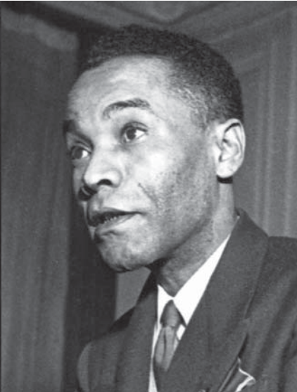
Léon Gontran Damas