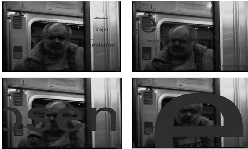
Figure 4. Extrait de Sous Terre par Grégory Chatonsky (2000). Une vingtaine de mots, par exemple « absence » ou « passages », s’agrandissent après avoir été activés par le lecteur, jusqu’à déborder l’espace d’affichage et passer hors-champ 16 .

reconnaît des scènes de métro, s’affichent des mots qui rétrécissent d’abord légèrement. L’activation d’un de ces mots par clic provoque ensuite une augmentation progressive de leur taille, jusqu’à un passage progressif hors cadre.