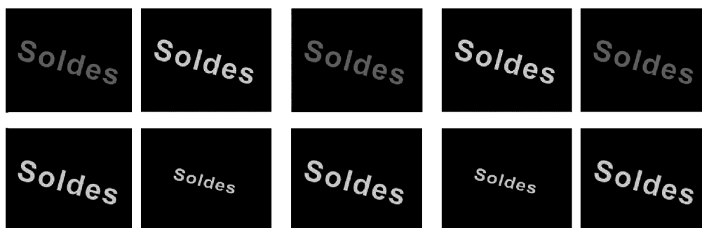
Figure 2. Le mot « soldes » change de couleur ou de taille à un rythme rapide et de façon réitérée sur ces deux bannières qui pourraient se trouver sur un site commercial. Modèles archétypaux construits à partir d'exemples de notre corpus 7 .

Celle-ci a été constituée par des processus d'intégration et de stabilisation d'expériences antérieures [...]. J'ai déjà vu des chats et je sais qu'ils ont des moustaches, qu'ils griffent, et qu'ils miaulent... Bref, j'en connais un bout sur les chats, et ce bout fait partie du type. (2000: 385)