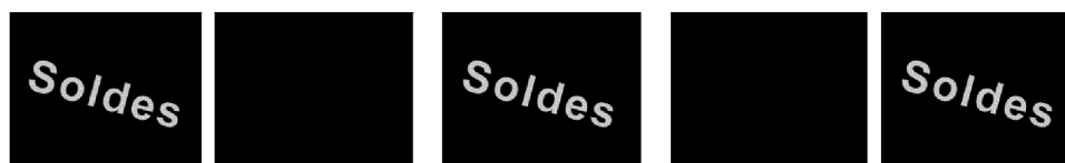
Figure 1. Le mot «soldes» clignote à un rythme rapide sur cette bannière qui pourrait se trouver sur un site commercial. Capture d'écran d'un modèle archétypal construit à partir d'exemples de notre corpus 6 .

Le clignotement «rappelle», par sa matérialité même, des phénomènes du monde physique: l'apparition et la disparition rapides de signaux lumineux sur les bords d'autoroutes, le clignotement des enseignes lumineuses dans les grandes villes ou