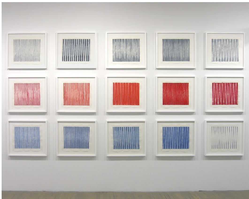
Série Contemplation, Série Perception, Série Silence, 2007-2008. Aquarelles sur papier | 42,5 x 47,5 cm chacune.