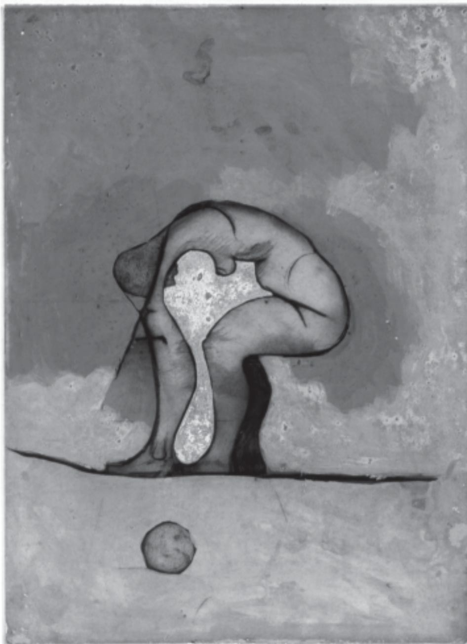
Suite Finlandaise , 2004, 65 x 50 cm.