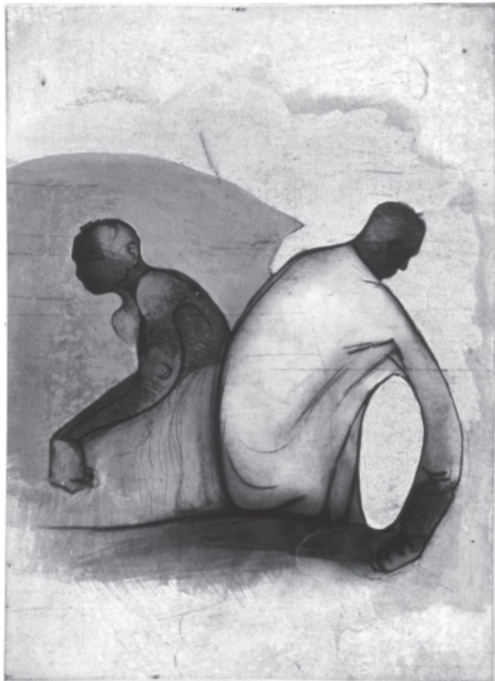
Suite Finlandaise I , 2004, 65 x 50 cm.