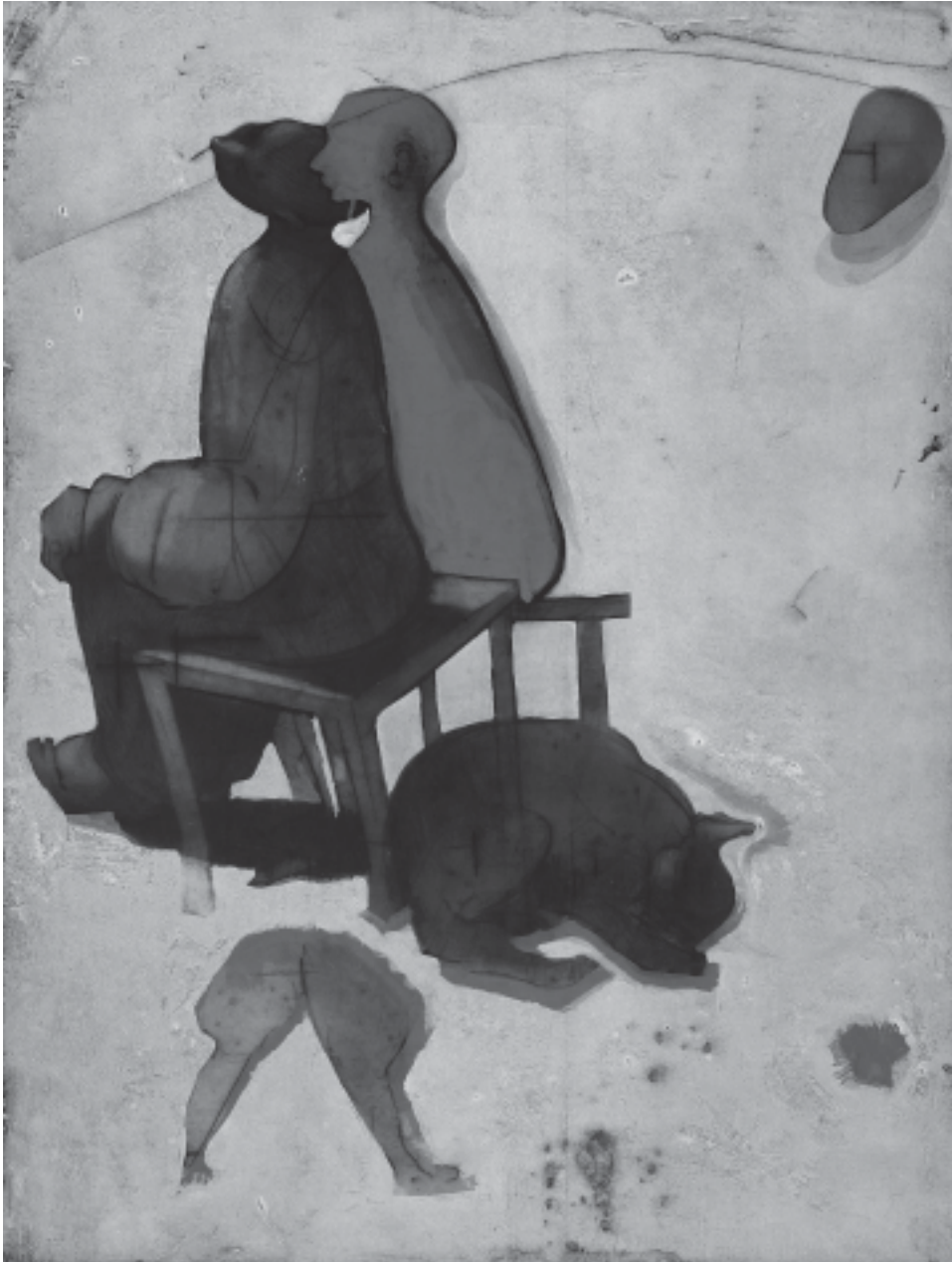
Germination, 2005, 65 x 50 cm.