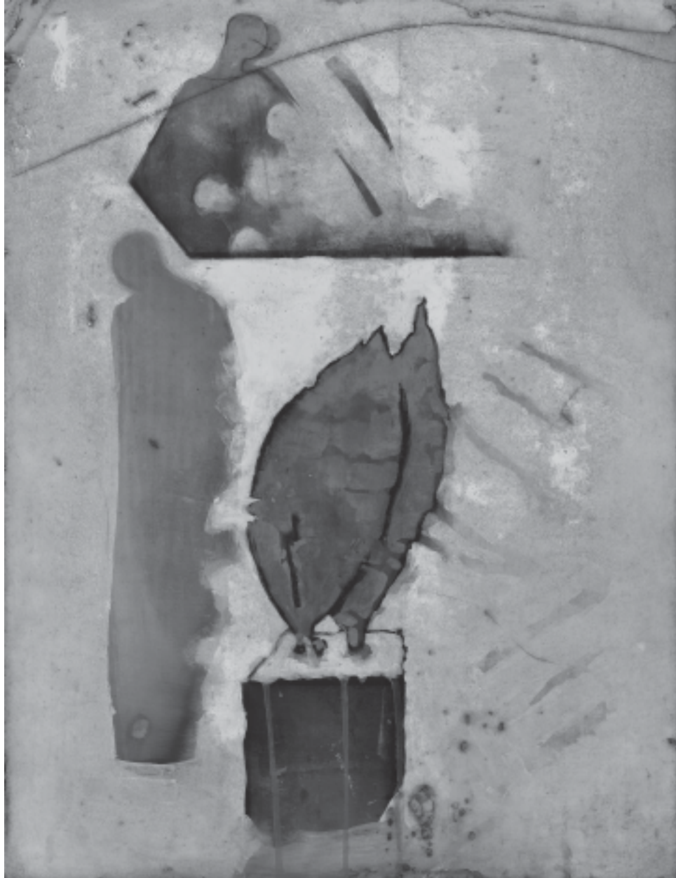
Possession , 2005, 65 x 50 cm.