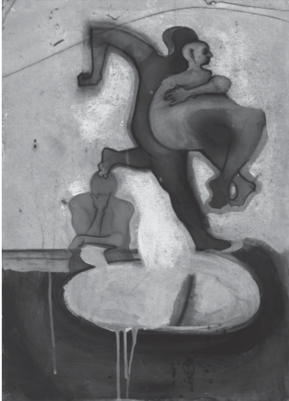
Le Perce-sommeil , 2005, 65 x 50 cm.