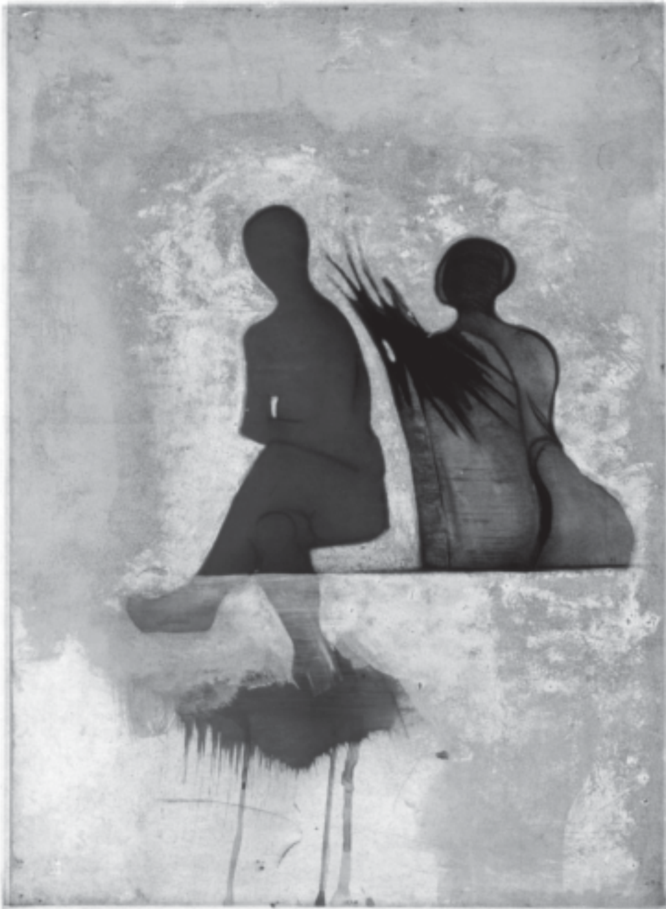
Suite Finlandaise , 2004, 65 x 50 cm.