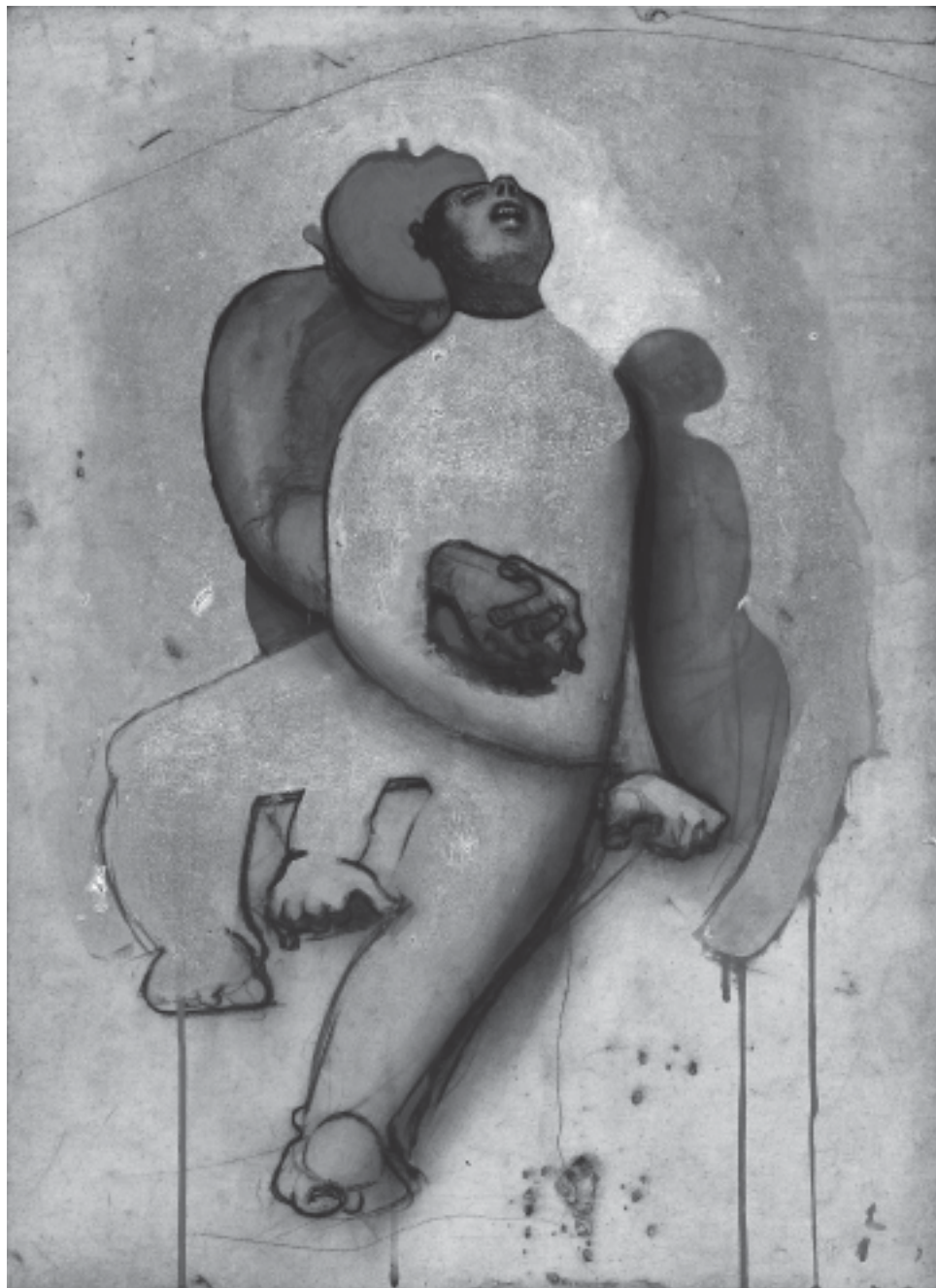
Travail de serre , 2005, 65 x 50 cm.