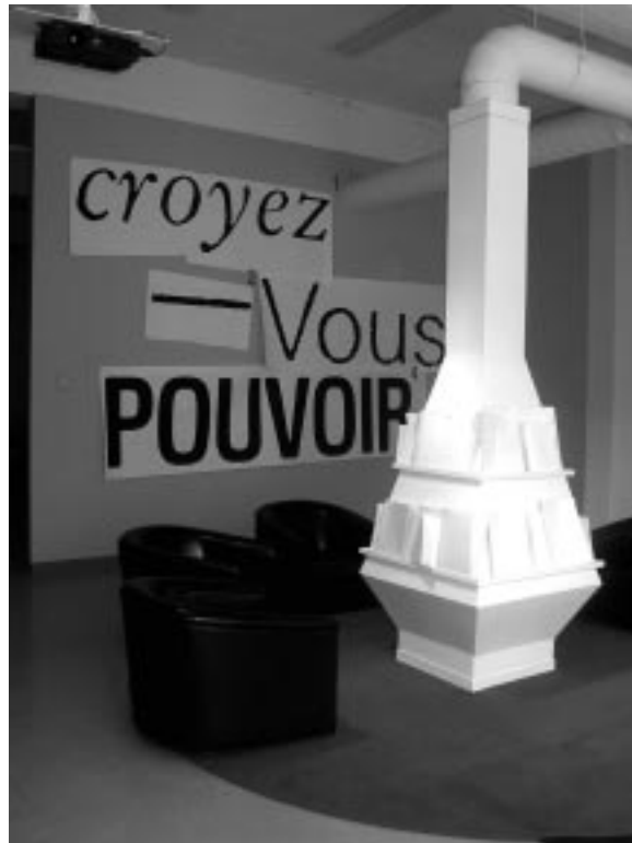
Mon régime (2005)