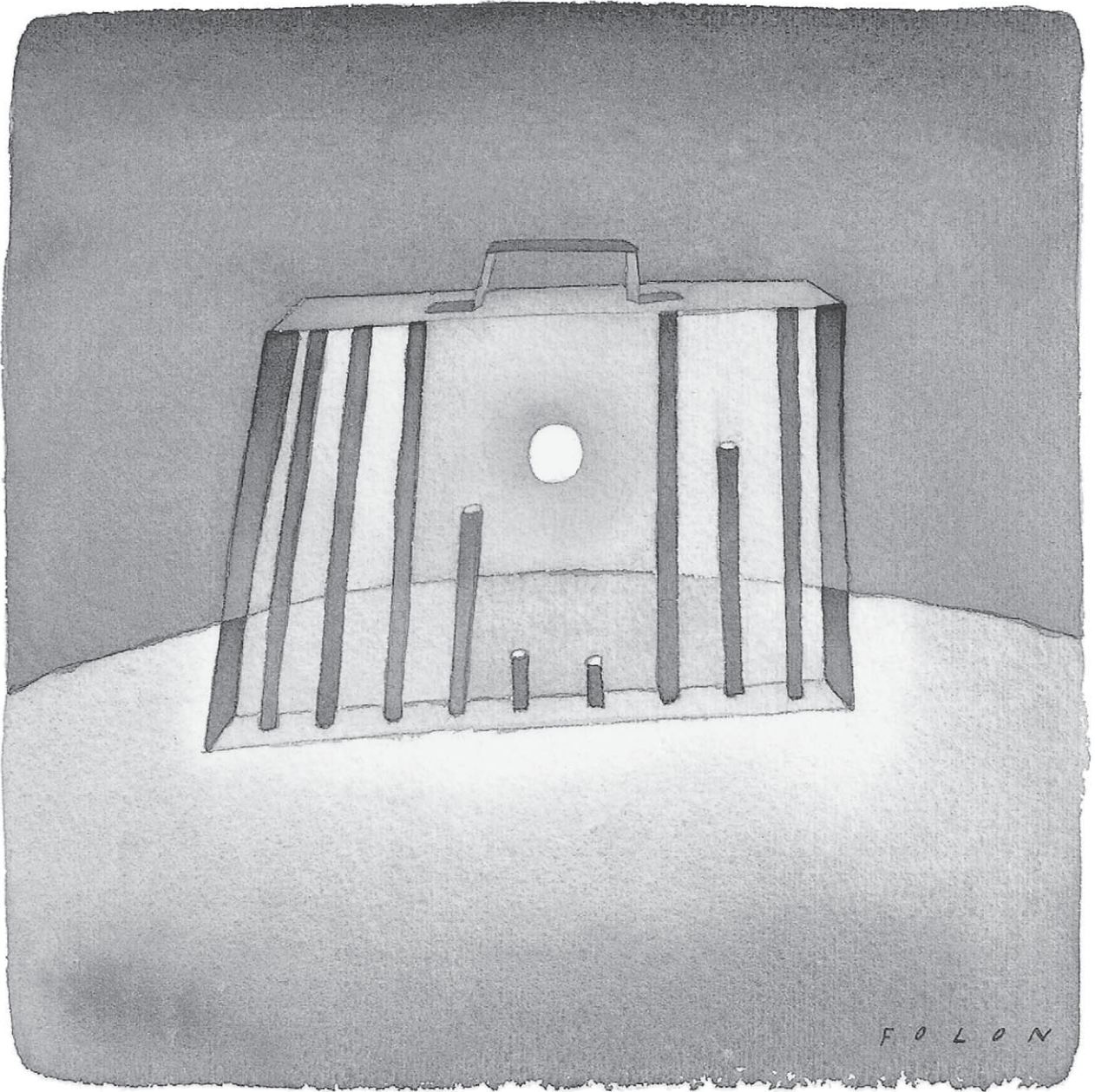
Déclaration universelle des droits de l'homme, 1988. © Jean-Michel Folon.