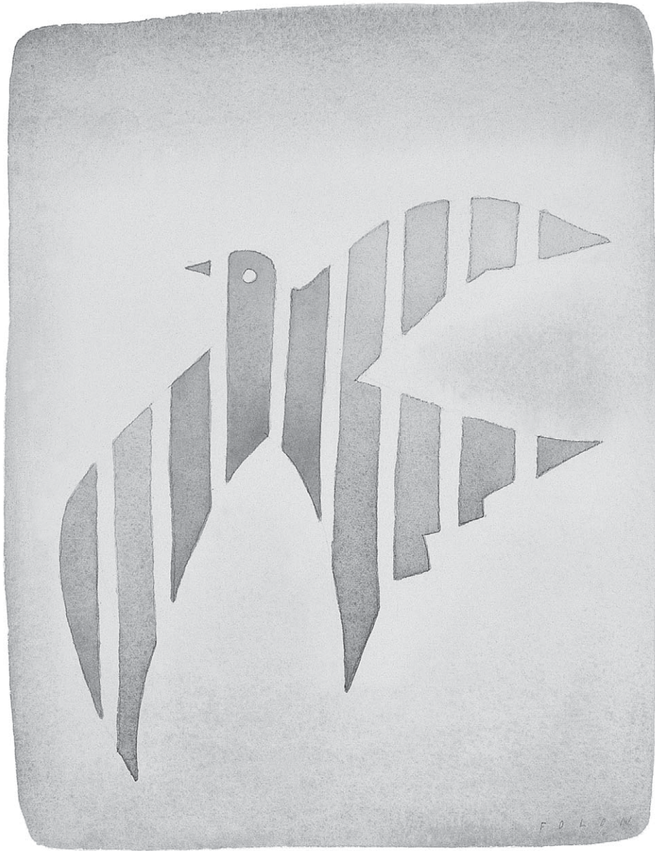
Libre. © Jean-Michel Folon.