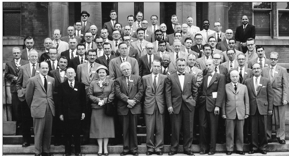
Figure 1a. Réunion annuelle 1958 de la SPPQ, tenue au Collège Macdonald (50 e anniversaire).