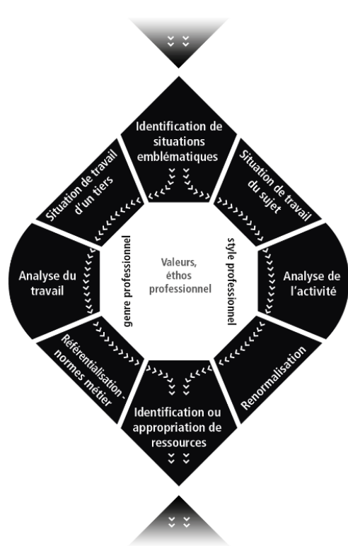
FIGURE 1: MODELE DE DIDACTIQUE PROFESSIONNELLE PAR ALTERNANCE ET SITUATION

Le modèle de didactique professionnelle par alternance et situation (DPAS) (Gremion, 2021b) se construit autour de 3 axes :