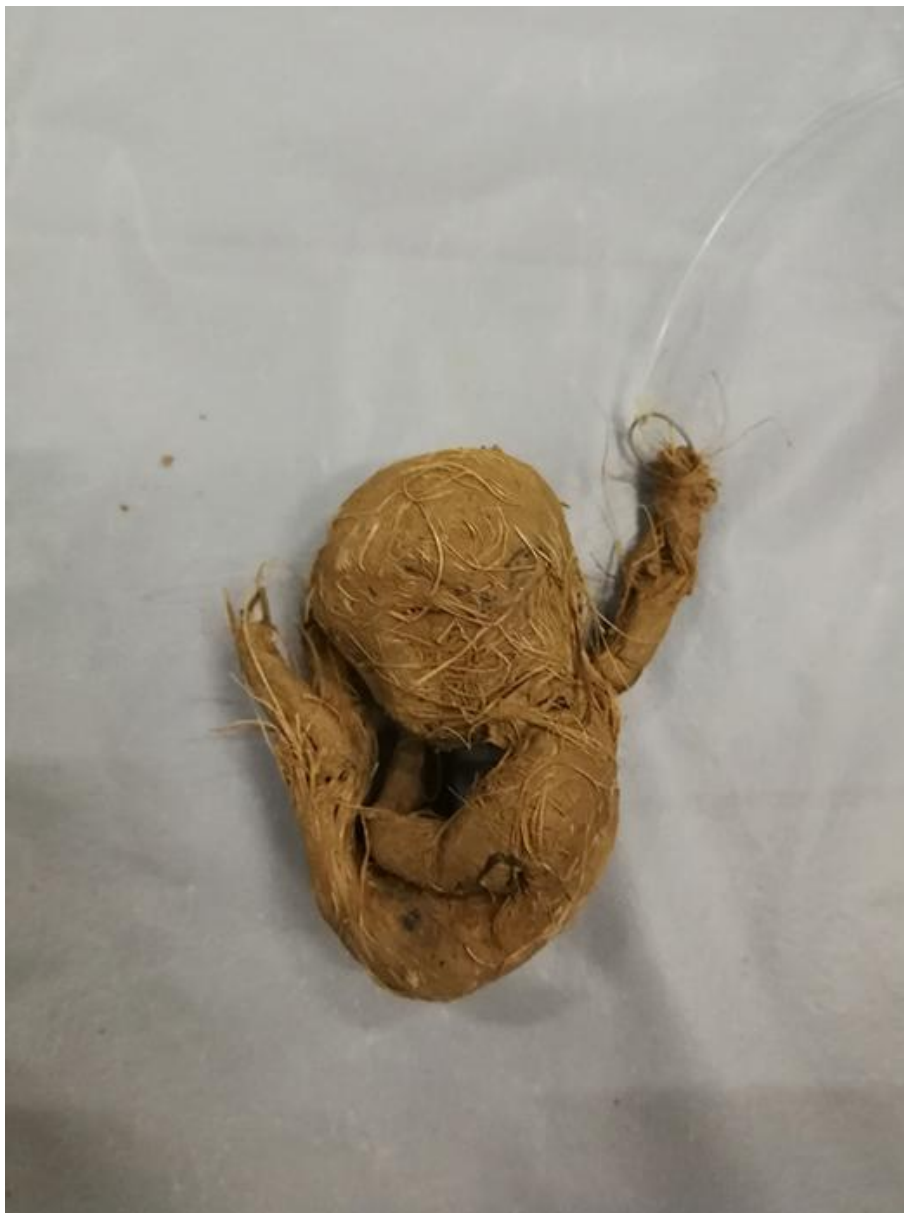
Essai d'une petite figure d'homuncule en marge d'une représentation de La messe de l'âne d'Olivier de Sagazan. Centre Dramatique de Rouen, Rouen (France), 2023.