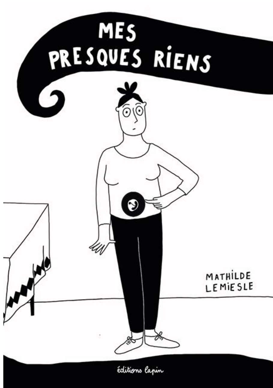
Mes presques riens (2021), couverture de l'ouvrage paru aux éditions Lapin.