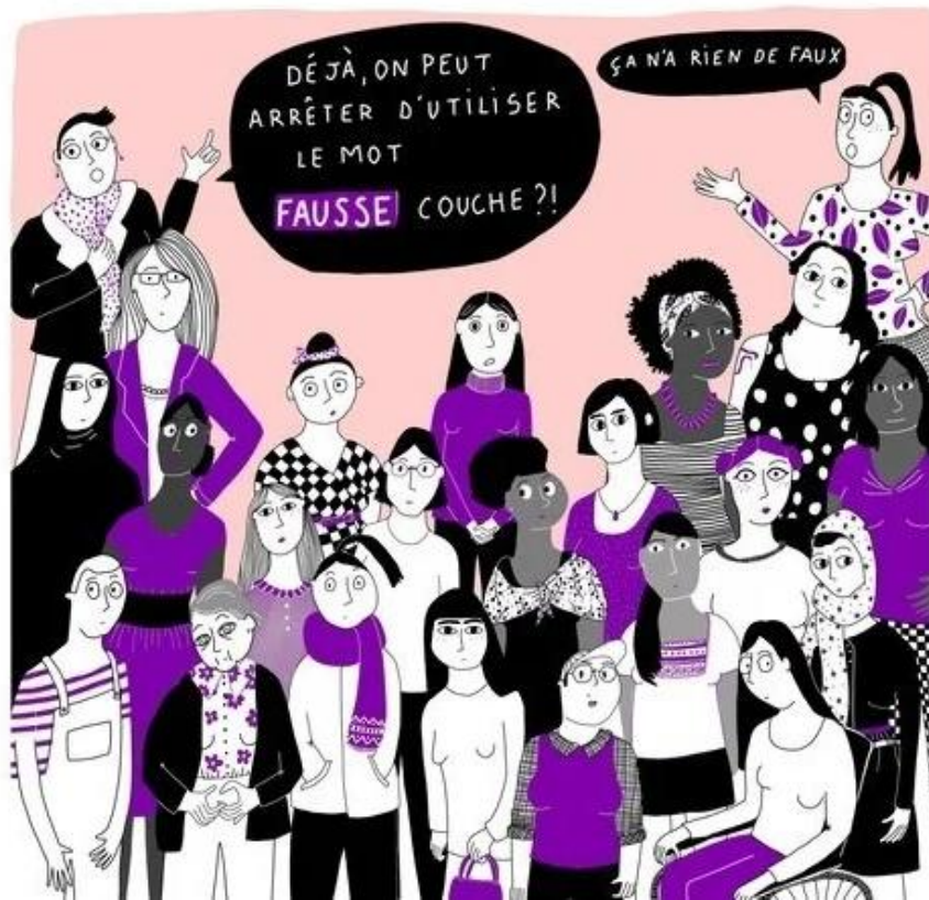
Fausse couche, vrai vécu , image pour la campagne de sensibilisation et la pétition en ligne. France, 2022.