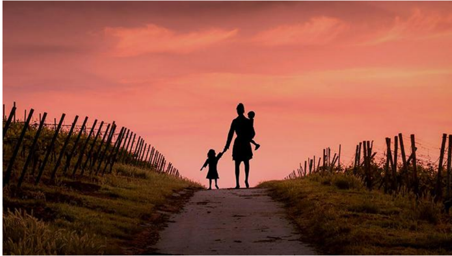
Une mère et ses enfants.