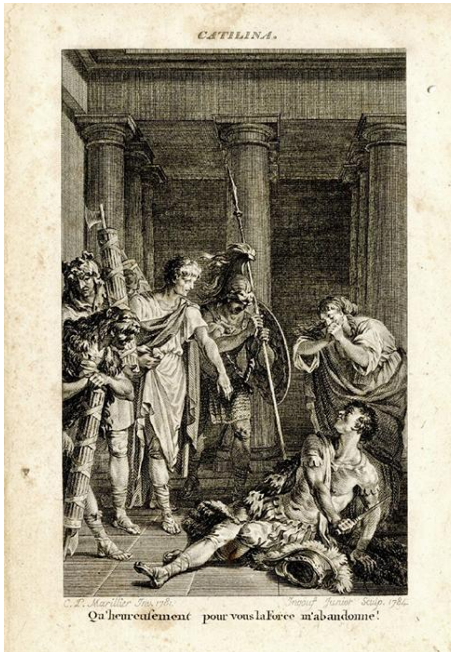
Gravure sur cuivre représentant la scène finale de Catilina . 1785.