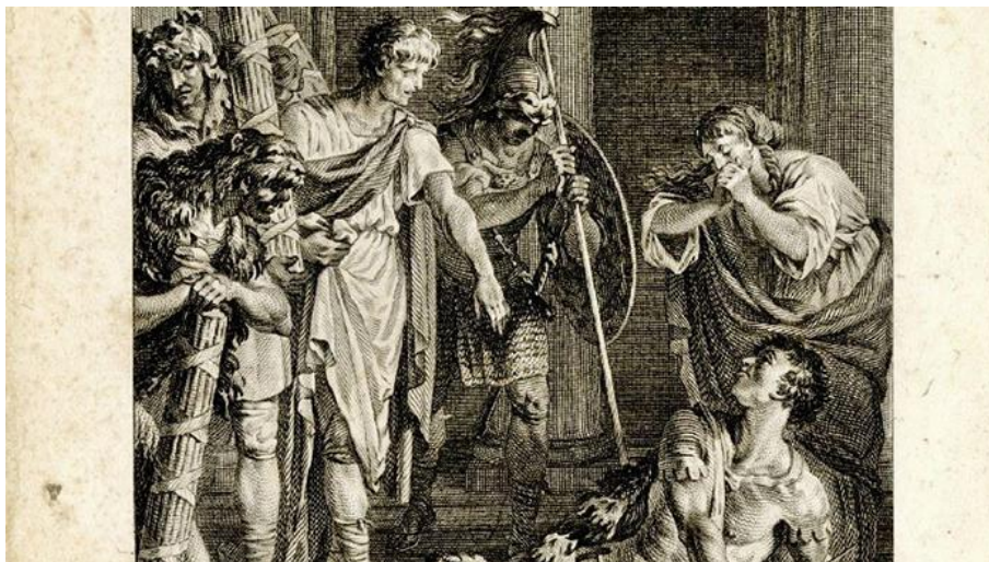
Gravure sur cuivre représentant la scène finale de Catilina . 1785.