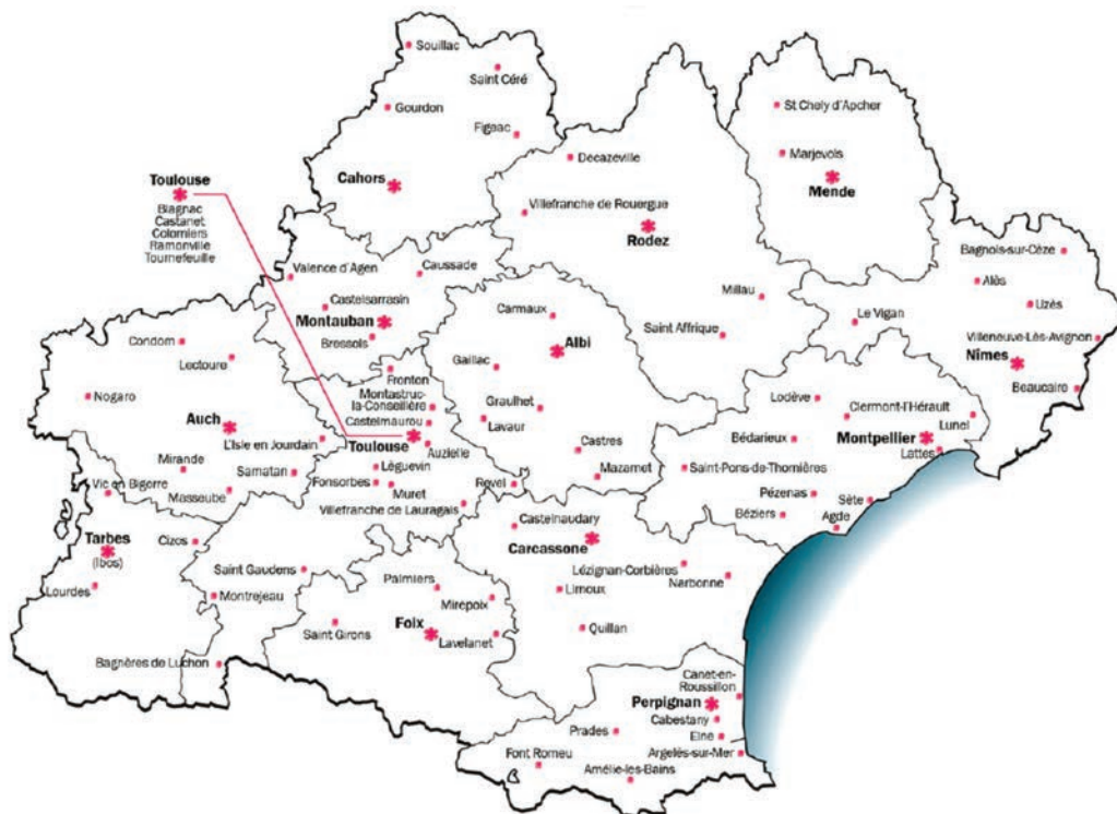
Figure 1. Carte de la région Occitanie et des 99 salles de cinéma impliquées dans le dispositif. Pour l'année 2020-2021, le dispositif LAAC en Occitanie a concerné 26 866 élèves, répartis dans 206 établissements scolaires des treize départements que compte la région : Ariège (09), Aude (11), Aveyron (12), Gard (30), Haute-Garonne (31), Gers (32), Hérault (34), Lot (46), Lozère (48), Hautes-Pyrénées (65), Pyrénées-Orientales (66), Tarn (81), Tarn-et-Garonne (82).

Mon travail prolonge cette réflexion. Il s'inscrit du côté du paradigme compréhensif et dans une démarche essentiellement empirique, reposant sur une expérience de quinze années de terrain en tant que coordinatrice, intervenante et formatrice, ainsi que sur l'analyse de questionnaires et d'entretiens semi-directifs menés dans le cadre de mon travail doctoral depuis 2020. Malgré les conditions liées à la crise sanitaire, 773 élèves reflétant en partie la grande diversité (en termes de territoires, de types d'établissement et de niveaux scolaires) des participants au dispositif en Occitanie ont ainsi pu s'exprimer en juin 2020 par le biais d'un questionnaire en ligne et anonyme présentant de nombreuses questions ouvertes. Un second questionnaire a été adressé en juin 2021 (moment correspondant à la réouverture des salles de cinéma en France) à un échantillon plus restreint, questionnaire auquel