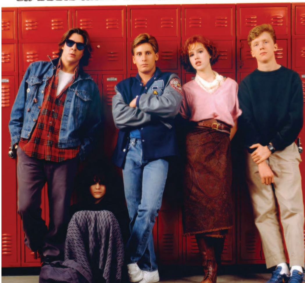
Figure 4. Plaquette présentant les films choisis dans le cadre du dispositif en Occitanie en 2019-2020 et intégrant une affiche du film Breakfast Club (John Hughes, 1985).