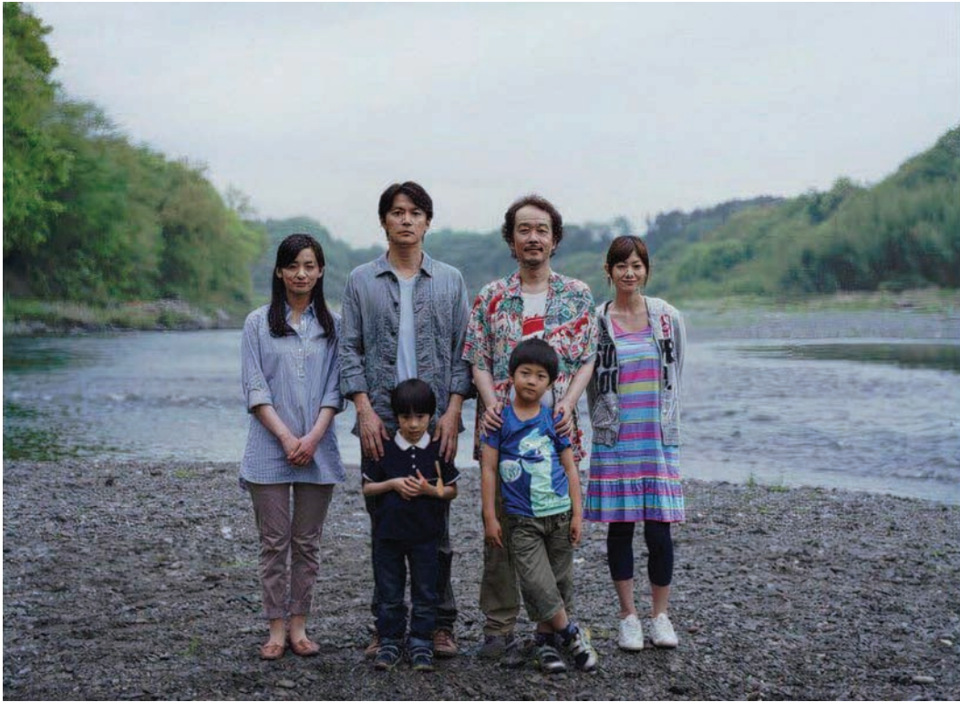
Figure 5. Photogramme tiré du film Tel père, tel fils (Hirokazu Kore-eda, 2013).

connaissances ou de culture générale , les commentaires permettent d'identifier néanmoins plusieurs catégories.