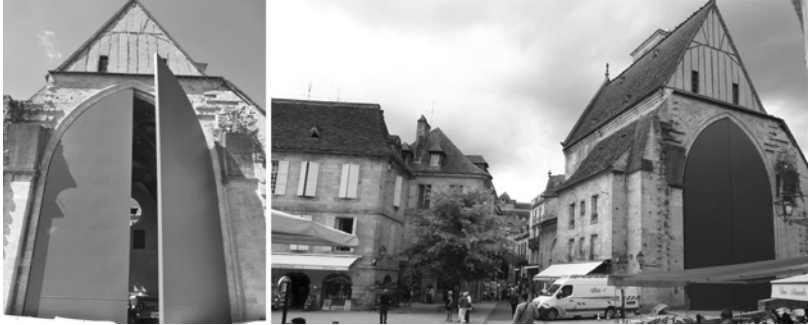
Figure 6 : Ancienne église Sainte-Marie et les portes conçues par Jean Nouvel à Sarlat

Si les villes patrimoniales peuvent parfois être candidement considérées comme de simples témoins de l'histoire, il nous faut souligner que la patrimonialisation « implique des tris, des choix donc des oublis 78 ».