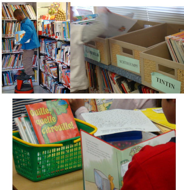
Exemple 3. Les rangements dans les bibliothèques et dans les classes

Dans aucune des écoles ni des classes observées, nous n'avons noté un rangement par langue des ouvrages et albums pour les enfants. Comme on peut le voir dans l'exemple ci-dessus (exemple 2), les albums en français, langue des classes observées, côtoient aussi bien en immersion française que dans les écoles francophones des albums dans d'autres langues: l'anglais et des langues européennes (comme l'allemand), mais aussi des langues non européennes et d'autres alphabets (le coréen). Les rangements existant le sont par ordre alphabétique (dans la bibliothèque de l'école, mais pas dans les classes), (parfois) par albums (les Tintin , les Schtroumpfs , les Garfield ), le plus souvent par niveaux de lecture (on trouve alors des petits paniers que peuvent prendre les élèves selon leurs habiletés dans la lecture autonome) (exemple 3).