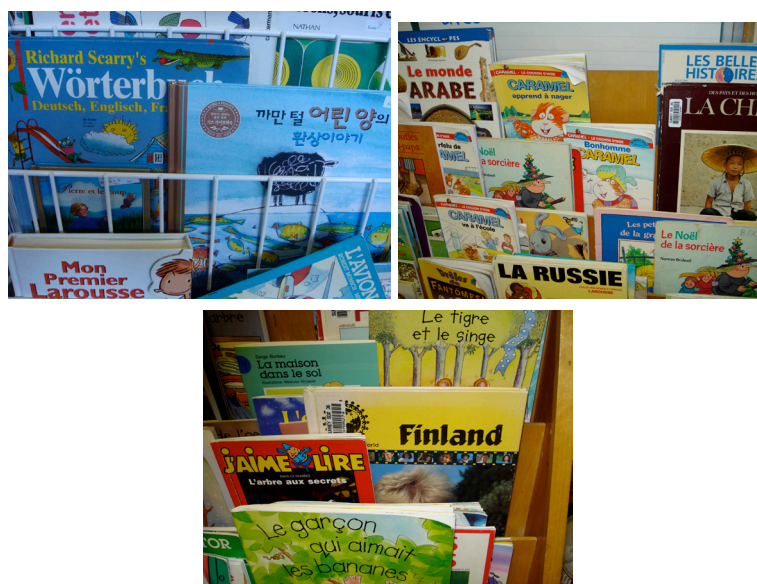
Exemple 2. La variété des livres disponibles dans les coins lecture dans les classes

Ces coins lecture se caractérisent tous par la pluralité des ouvrages qui s’y côtoient et se définissent d’emblée comme des lieux où plusieurs langues et cultures sont en contact et sont mis au service de l’entrée dans la littérature du et en français (exemple 2). Ainsi, à côté d’ouvrages techniques propices au développement d’une langue normée et scolaire – Mon premier Larousse et le Dictionnaire actif Nathan , cohabitent d’autres livres qui racontent Les Belles Histoires , soulignent le plaisir de l’acte de lire avec la collection J’aime lire , ou font sur le mode informatif découvrir le monde animal comme Les araignées et leurs toiles . Certains sous forme d’atlas invitent à la découverte d’environnements lointains, tels La Russie , La Chine ou Le monde arabe , en français ou en anglais ( Finland ), soulignant par là même la cohabitation des deux langues du Canada dans la classe. D’autres mettent en scène différents personnages dans diverses situations, Caramel apprend à nager , L’espion sous l’eau , La visite de grand-maman , pour ne citer que quelques exemples. Les thématiques sont en lien avec le monde de l’enfance et de l’imaginaire, mais également avec les sujets abordés par le curriculum; elles soulignent plus ou moins explicitement certains traits culturels, notamment locaux et spécifiques à la Colombie-Britannique.