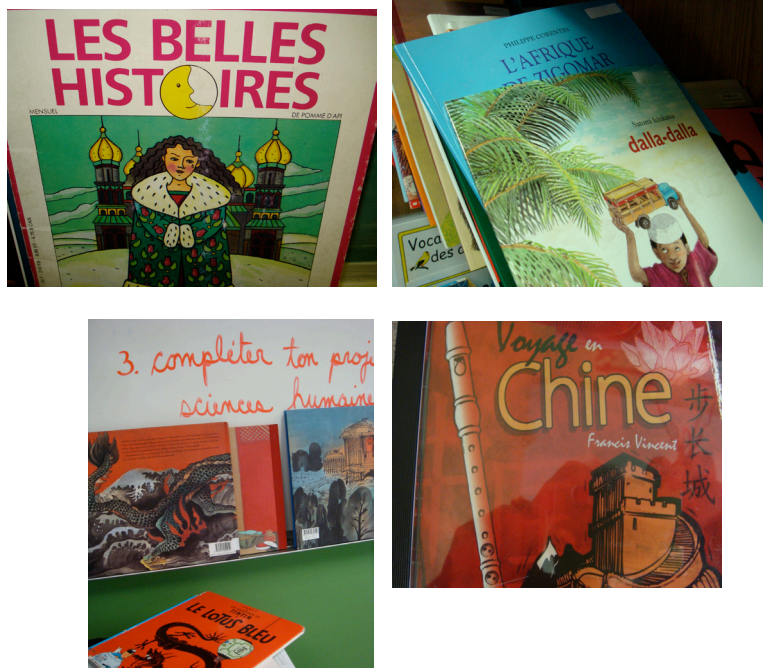
Exemple 6. Les Belles Histoires , L'Afrique de Zigomar , dalla-dalla , Tintin et le lotus bleu et Voyage en Chine

Dans toutes les classes observées, illustrant le type d) des livres plurilingues, on note la présence de nombreux contes autochtones canadiens, en français, en anglais, bilingues ou trilingues, parfois dans plusieurs systèmes d'écriture. Outre la présence dans le texte en français de noms de personnages clairement autochtones (Anaanatsiaq, Eskéo dans Les Papinachois et le panier d'écorce ) ou l'utilisation d'un lexique emprunté (les lemmings) ou le style des illustrations ( L'équipée fantastique ), la présence de l'autre ainsi que sa valorisation peuvent également se traduire par la graphie qui est utilisée pour raconter l'histoire. Ainsi dans l'ouvrage Un Inukshuk solitaire ou encore La grand-mère d'Aputik (exemple 7), rencontrés dans les coins bibliothèque de plusieurs classes d'immersion et du programme francophone, la dimension bilingue et pluriculturelle apparaît à la fois dans l'utilisation de la version syllabaire de l'inuktitut et sa présence aux côtés de la langue française, bien que située en dessous, et dans la mise en exergue des liens intergénérationnels et de la place sociétale majeure des aînés dans les communautés autochtones. La disposition des langues et leur partage de et sur la page révèlent la manière dont chaque langue possède et occupe son espace. Ils illustrent aussi, symboliquement, la cohabitation des langues et des cultures, à l'image d'un Canada officiellement bilingue et multiculturel.