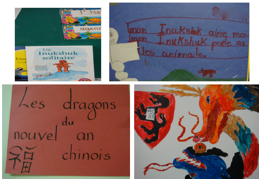
Exemple 8. L'Inukshuk solitaire (Classe de J. – Immersion) et Les dragons du nouvel an chinois (Classe de B. – Programme francophone)

Les séquences d'exploitation didactique des livres bi-/plurilingues menées par les enseignants révèlent toutes l'instauration d'un espace collaboratif pour partager des savoirs et des pratiques autour des littératies scolaire, familiale et communautaire et construire ensemble des compétences plurilittératiées. Dans les classes où les études de cas ont été menées, les livres bi-/plurilingues en circulation participent à établir, par delà les coins bibliothèque, l'espace de la classe comme un espace bi-/plurilingue et pluriculturel et d'ouverture à l'altérité, où circulent et se négocient des formes diverses de savoirs qui se construisent et s'appuient sur les expériences et les capitaux culturels et symboliques des élèves (Perregaux, 2009).