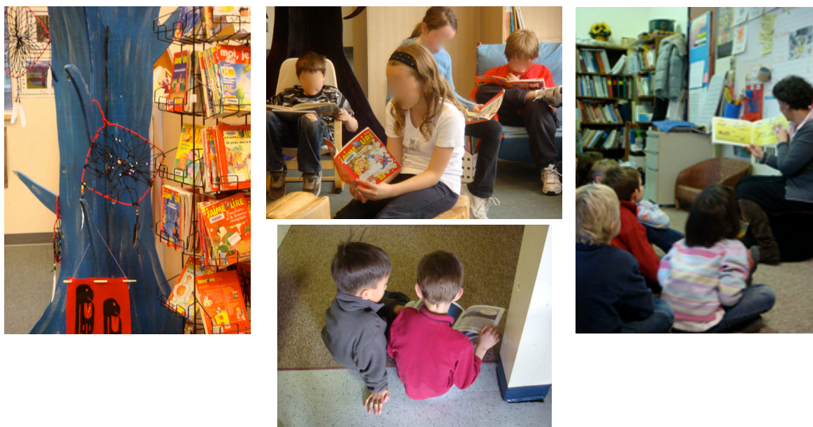
Exemple 1. Coin bibliothèque et coins lecture dans les écoles et les classes

L'espace physique de la salle de classe participe à inscrire la construction des compétences et des savoirs littératiés dans la spécificité des classes dans lesquelles elle est observée (Moore et Sabatier, 2010 et 2012). L'aménagement pédagogique de cet espace permet de saisir la manière dont chaque enseignant organise spatialement, entre autres, l'entrée dans le monde de la littérature, et plus particulièrement pour ce qui nous intéresse ici: le monde du livre. Dans chacune des sept classes participant aux études de cas, se sont dégagées différentes aires d'enseignement et d'apprentissage autour de la littérature: si chacune des écoles dispose d'une bibliothèque commune que les enfants ont coutume de fréquenter, chaque classe agençait un coin bibliothèque (le «coin lecture»), souvent organisé autour de chaises en rotin ou d'un sofa, agrémentés de coussins colorés, d'attrapeurs de rêves, d'arbres en papier mâché, parfois de réels troncs transformés en tabourets. Les enfants lisent à leur pupitre, dans ces coins lectures, seuls ou en groupe, avec l'enseignant, assis ou couchés par terre (exemple 1).