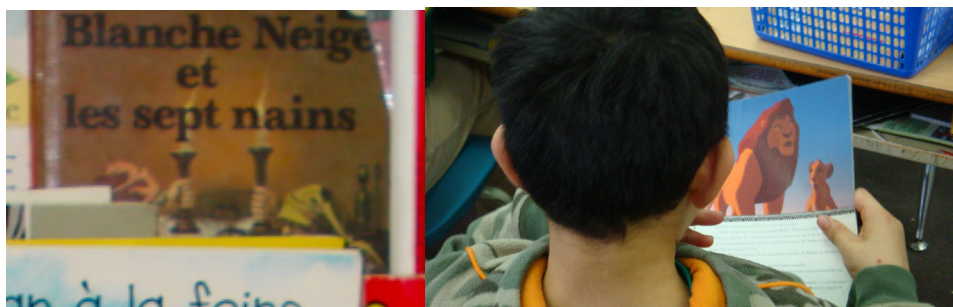
Exemple 4. Blanche-Neige et les sept nains et Le Roi lion

commun désormais translocal et national. En dépit d'une apparente unicité sémiotique, graphique et linguistique, les dimensions d'une plurilittératie n'en sont pas moins présentes. Ce conte est inspiré par un mythe germanique; il est ancré dans des traditions européennes et le récit a été popularisé au 19 e siècle dans la littérature par les frères Grimm, puis par un film d'animation américain au 20 e siècle. Le Roi lion , pour sa part, dont la version animée The Lion King des studios Disney date de 1994, raconte l'histoire de Simba, un lionceau d'Afrique qui doit succéder à son père. Le lion s'inspire aussi largement de l'œuvre littéraire de Shakespeare ( Hamlet , 1603), mais aussi d'un manga japonais d'Osamu Tezuka ( Le Roi Léo , 1951; [ジャングル大帝, Janguru Taitei]).