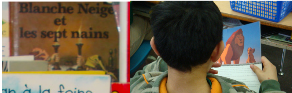
Exemple 4. Blanche-Neige et les sept nains et Le Roi lion

commun désormais translocal et national. En dépit d'une apparente unicité sémiotique, graphique et linguistique, les dimensions d'une plurilittératie n'en sont pas moins présentes. Ce conte est inspiré par un mythe germanique; il est ancré dans des traditions européennes et le récit a été popularisé au 19 e siècle dans la littérature par les frères Grimm, puis par un film d'animation américain au 20 e siècle. Le Roi lion , pour sa part, dont la version animée The Lion King des studios Disney date de 1994, raconte l'histoire de Simba, un lionceau d'Afrique qui doit succéder à son père. Le lion s'inspire aussi largement de l'œuvre littéraire de Shakespeare ( Hamlet , 1603), mais aussi d'un manga japonais d'Osamu Tezuka ( Le Roi Léo , 1951; [ジャングル大帝, Janguru Taitei]).