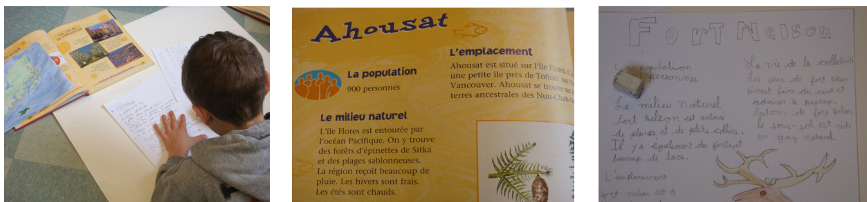
Exemple 10. Classe du programme francophone (Classe de R.)

La démarche didactique de ces enseignants explicite un ancrage situé et expérientiel des apprentissages (conformément aux attendus ministériels édictés par BC's Education Plan , ministère de l'Éducation de la Colombie-Britannique 2011, p. 3), car c'est par la compréhension et la saisie du contexte dans lequel il vit, évolue, se déplace que l'élève donne du sens à son expérience scolaire et extrascolaire (Moore et Sabatier, 2012). Lors des entretiens d'explicitation sur leurs pratiques de classe, les enseignants insistent sur la manière dont ils tissent l'articulation entre savoirs disciplinaires, artistiques et linguistiques, et sur la façon dont ils prennent appui sur les connaissances des parents et les expériences des enfants pour faciliter la rencontre et l'ouverture à l'altérité, le développement des savoir-être et le respect des rituels, tout comme la responsabilisation et l'inscription citoyenne dans la collectivité locale et globale. Ce faisant, c'est bien clairement une compétence de médiation qui se donne à voir, car l'approche du développement de la littératie s'inscrit dès lors dans une perspective écologique qui conduit au développement d'un rapport à l'écrit personnalisé chez chacun des élèves et favorise l'articulation entre les mondes dans lesquels circulent les enfants: la famille, l'école et la communauté.