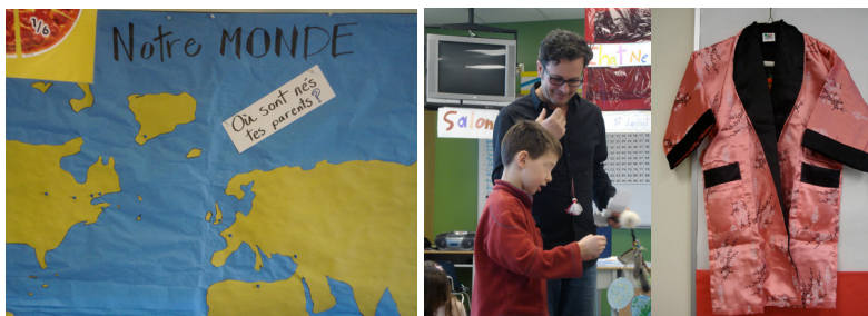
Exemple 9. Classes du programme francophone – Classes de Y. et de R.

Pour construire les compétences du lire-écrire, les scénarios pédagogiques des enseignants prennent donc appui sur des articulations réfléchies entre les expertises scolaires et familiales et communautaires, ainsi que sur la valorisation des savoirs d'expériences des apprenants comme des atouts et des leviers d'apprentissage pour aider leurs élèves à se coconstruire dans ces milieux différents, mais complémentaires. La centration des pratiques pédagogiques autour de la personnalité de l'enfant et de ses univers afin de viser chacune des dimensions (cognitives, affectives et sociales) nécessaires à son épanouissement est un des principes qui fondent la culture éducative des classes britanno-colombiennes. Les enseignants s'attachent à développer, à côté des savoirs scolaires, des savoir-être et des savoir-vivre qui participent au bien-être de l'enfant.