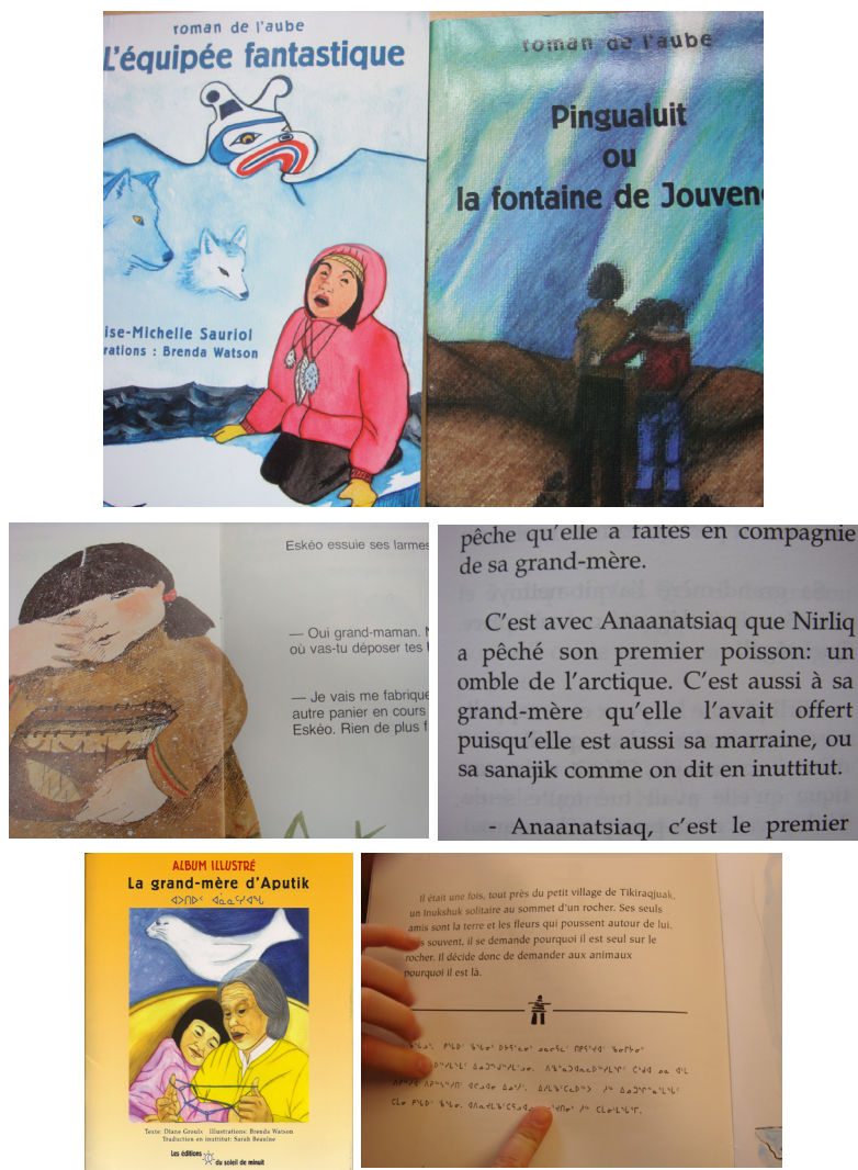
Exemple 7. L'équipée fantastique , Les Papinachois et le panier d'écorce , La grand-mère d'Aputik et Un Inukshuk solitaire (Classes de R. et de C., Programme francophone)

L'entrée dans l'écrit s'effectue ici par l'utilisation concomitante de deux systèmes d'écriture et s'inscrit donc au niveau des alphabets, qui dès lors deviennent des objets culturels par essence, alors que les dimensions d'oralité des langues qui interagissent avec leurs variétés scripturales, l'inscrivent dans des référents sémiographiques (illustrations, symboles, couleurs, lettrages) (Moore, 2012) conditionnés par l'univers de référence culturel auquel le récit veut se rattacher. Si l'histoire peut se raconter et se lire en français, elle réfère de par sa scénographie et son visuel à un univers autochtone régi par des codes culturels précis. Dans un environnement sociolinguistique et culturel comme la Colombie-Britannique où de nombreuses langues autochtones sont encore présentes, ces livres dans les salles de