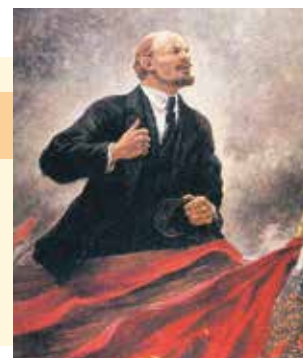
Francis de Miomandre