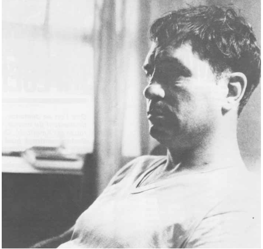
Jack Kérouac à Hyannis, Massachusetts, 1966.

Salinger, The Catcher in the Rye , dans lequel la voix du jeune Holden Caulfield nous restait en mémoire longtemps après avoir refermé le livre. Là est la force de ces œuvres qui s'imposent en se frayant un chemin jusqu'à nous sans solliciter notre adhésion première et inconditionnelle. Kérouac ne cherchait pas uniquement à reproduire la langue parlée de son enfance (faut-il ici rappeler qu'il n'a parlé que le français jusqu'à l'âge de six ans), le franco-américain, qu'il ne considère et ne traite nullement comme un appauvrissement du français parlé au Québec ou en France, mais il se voulait aussi le témoin, voire le chantre du désespoir vécu par ces milliers d'expatriés qui n'ont jamais oublié leur foyer d'origine et qui ont souvent vécu dans des