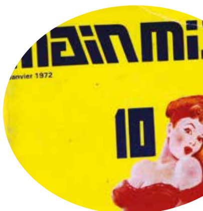
Mainmise, n° 10, janvier 1972