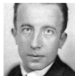
Paul Éluard en 1930

L'entreprise d'Antoine Volodine est unique dans le paysage littéraire français. Son dernier, publié sous le pseudonyme de Lutz Bassmann, Danse avec Nathan Golschem (Verdier), construit comme ses précédents livres un univers absurde, parfois squelettique, noir, à la limite du comique, dans lequel les héros cherchent désespérément une voie de passage.