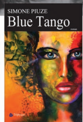
SIMONE PIUZE Blue Tango roman, 323 p., 24 $