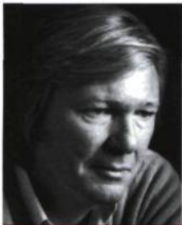
Jacques Sassié / Gallimard