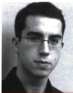
B. Cannarsa / Opale