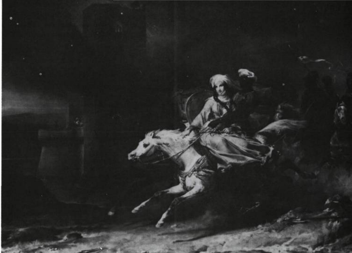
Léon Cogniet. Rébecca et sir Brian du Bois Guilbert (1828). La toile est inspirée d'un passage du roman Ivanhoé de Walter Scott.