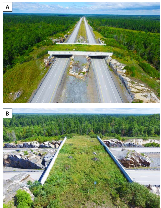
Figure 2. Passage faunique supérieur (écopont) de Burwash : a) implantation au niveau d'un point de concentration des collisions véhicules-faune, afin de réduire les impacts de la construction de l'autoroute sur le corridor de déplacement de la faune; b) plantation d'espèces indigènes d'arbres, d'arbustes et d'herbacées sur le tablier de l'écopont.

L'écopont de Burwash est entièrement composé de béton et constitué de 2 sections de ponts bout à bout qui reposent sur des affleurements rocheux (figure 2a). Les dimensions finales totales de la structure combinant les 2 ponts sont de 70 m de long et de 30 m de large. Le tablier de l'écopont a été aménagé afin de recréer un environnement relativement naturel, avec un substrat de 60 cm de terre sur lequel poussent des arbres, des arbustes et des herbacées indigènes (figure 2b). L'écopont a été conçu de façon à pouvoir supporter le poids additionnel du sol et de la végétation, ainsi que les fortes précipitations et les accumulations de neige. L'accès à l'écopont par le public est interdit. Des panneaux d'interdiction de stationnement ont été installés sur l'autoroute à proximité de l'écopont, et la barrière restreignant l'accès piétonnier est cadenassée. Le coût total de construction de cette structure s'élève à environ 2,9 millions $ CA.