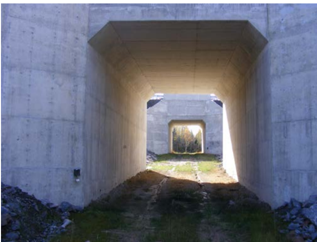
Figure 3. Le passage faunique inférieur (écoduc) de Burwash comprend 2 ponceaux carrés identiques et une ouverture médiane clôturée.

Le suivi de l'efficacité des mesures d'atténuation des impacts sur la faune a débuté en 2011, soit 1 an avant l'ouverture officielle de la nouvelle autoroute au trafic routier. Ce suivi comprend l'utilisation de passages fauniques, de portes d'évacuation et de clôtures d'exclusion faunique. Le programme de suivi a été conçu par Eco-Kare International, une firme de consultants en environnement spécialisés en écologie routière. Le suivi consistait à disposer des caméras à déclenchement automatique par le mouvement (de marque et modèle Reconyx HC 600) à des endroits soigneusement choisis afin de fournir une couverture appropriée, et à réaliser le pistage hivernal de traces et d'indices de présence animale dans toute l'aire d'étude (soit le tronçon de 10 km d'autoroute et son emprise). Les résultats obtenus lors du