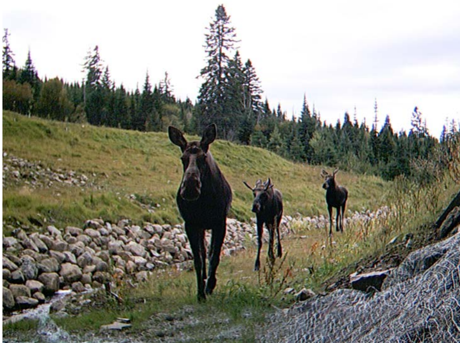
Figure 4. Photos d'orignaux s'engageant dans le passage faunique de la décharge du lac à Noël (Réserve faunique des Laurentides, km 94; caméra Moultrie).

* H. Bastien, MRNF, comm. pers.; MRNF, 2010.