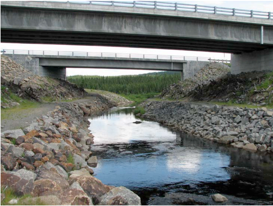
Figure 1. Passage faunique à 2 sentiers de la décharge du lac Tourangeau (Réserve faunique des Laurentides, km 177).

suivi a été effectué le long de la route 175 entre Québec et Saguenay, majoritairement à l'intérieur des limites de la RFL dans le cadre du réaménagement de cet axe routier pour en faire une route à 4 voies divisées. En 2000, le débit journalier moyen de cet axe nord-sud était de 3 300 à 4 800 véhicules, avec une pointe estivale variant de 4 600 à 6 300 véhicules (Consortium Genivar-Tecsult, 2003).