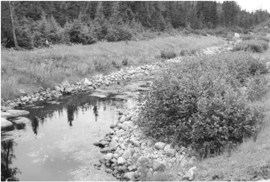
Figure 4. Cours d'eau reconstitué et aménagé pour favoriser l'omble de fontaine.