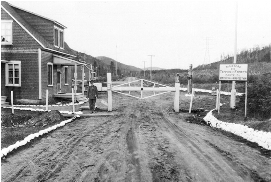
Figure 2. Barrière contrôlant l'accès au Parc des Laurentides en 1938.

En 1927, un corridor de transport d'électricité fut ouvert entre Québec et le SLSJ. La route ayant servi à la construction de la ligne électrique devint alors le premier lien routier direct entre Québec et le SLSJ, nommée « la route des poteaux » (figure 2). L'Union nationale, le parti politique au pouvoir à l'époque, lança, en 1945, un vaste projet afin de construire un vrai lien routier pour desservir la région du SLSJ, « le boulevard Talbot » (alors route 54, changée pour route 175 en 1975), du nom du ministre de la voirie Antonio Talbot. Le projet, qui devait coûter 6 millions de dollars, mais qui en coûta plutôt 22 millions, se termina en 1948 (en comparaison, le projet de réfection de la route 175 débuté en 2006 avait un budget prévu de 1,1 milliard de dollars). Cette route traversait le parc national des Laurentides, ce qui explique qu'on devait franchir une barrière et s'enregistrer à l'entrée et à la sortie. Cette route, à l'origine de faible gabarit, recevait peu de circulation (quelques centaines de véhicules par jour ; aujourd'hui, le débit moyen est plutôt de 5 600 véhicules par jour).