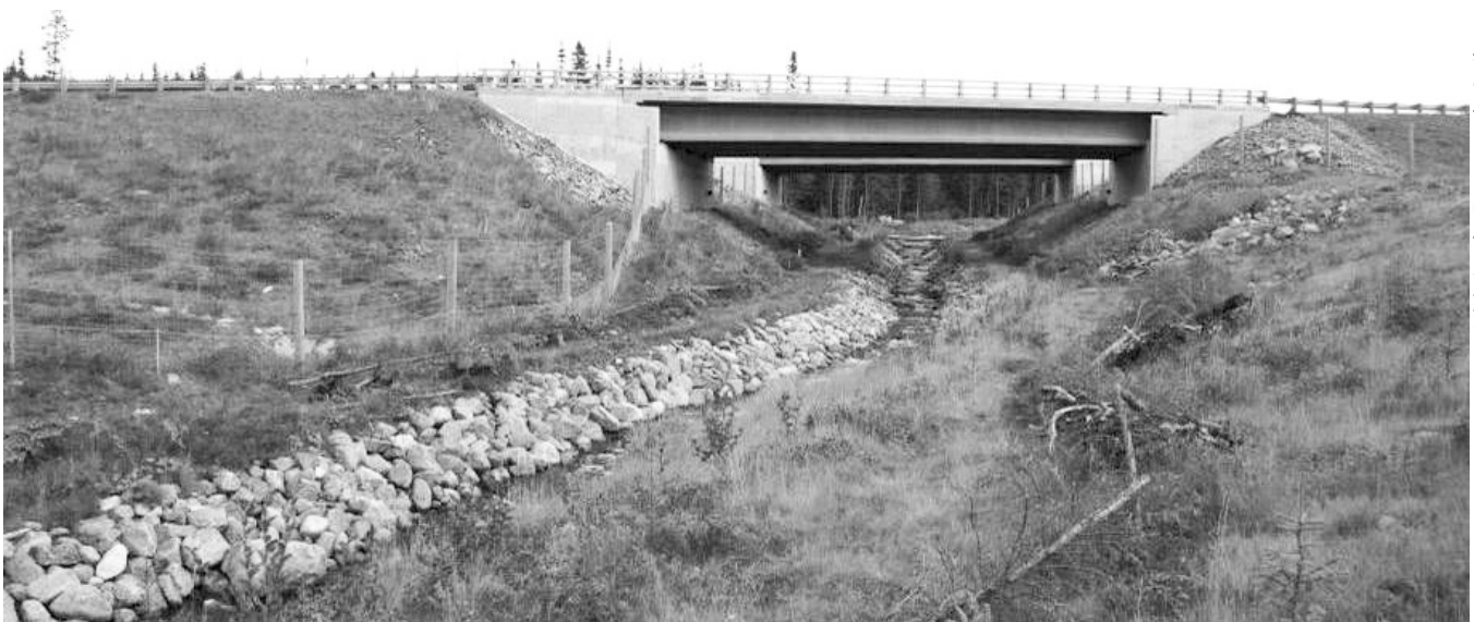
Figure 5. Passage faunique sous la route 175 dans la réserve faunique des Laurentides, aménagé pour l'orignal. Les clôtures sont des équipements essentiels pour assurer l'efficacité des passages fauniques.

Enfin, la petite faune, qui ne représentait pas non plus un enjeu pour la sécurité routière, a tout de même été considérée dans notre étude des impacts de la nouvelle route. Nous croyions que la nouvelle route qui allait passer d'une emprise de 35 m à une emprise de 90 m allait accentuer le phénomène de fragmentation des habitats en diminuant les échanges génétiques, en limitant la dispersion des jeunes