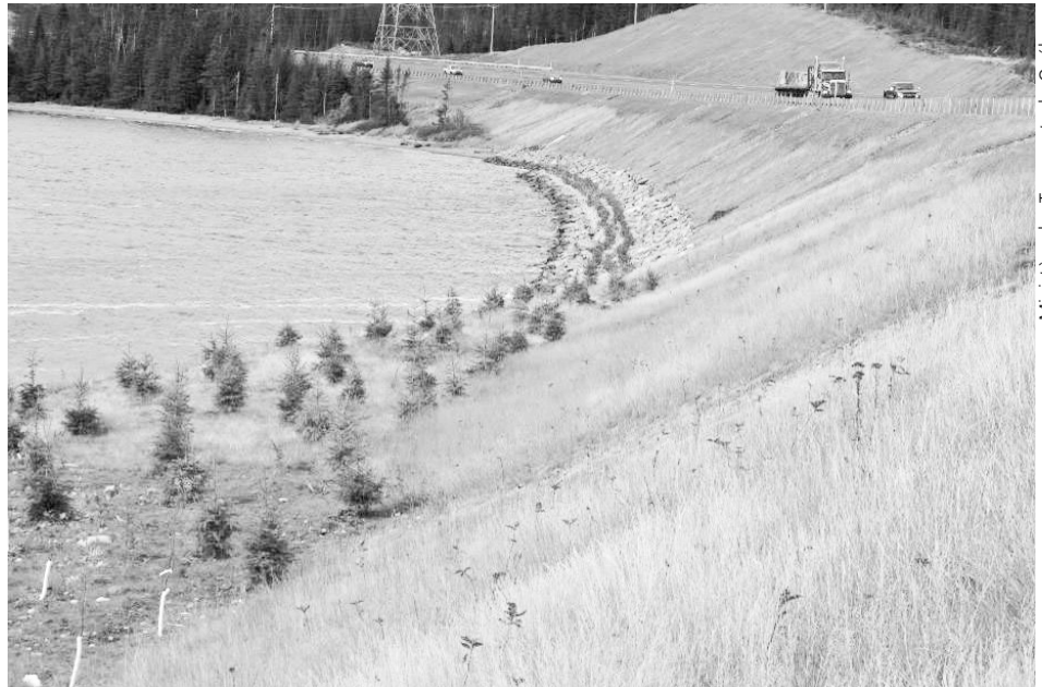
Figure 3. Talus ensemené et planté. Préalablement aux interventions de végétalisation, le talus était entièrement composé de roc dynamité. Ici, le remblai a été prolongé au niveau de la berge pour recréer l'écotone riverain.

D'importants efforts ont été consentis pour restaurer le couvert végétal et ainsi assurer l'intégration paysagère et restaurer les habitats perturbés tant pour la faune aquatique que pour la faune terrestre (figure 3). Les ensemencements furent les techniques les plus utilisées pour restaurer la végétation ; ils eurent essentiellement un rôle de stabilisation