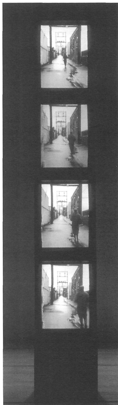
FIGURE 1 Waquant, Michèle En attendant la pluie/ Waiting for the Rain , 1987 4 moniteurs, support, 4 vidéo- grammes couleur, 11 min., son, 315 x 51 x 49,5 cm

La seconde conception oblige certes la mise en application de stratégies plus à risque comme la migration, mais assure, lorsque autorisée par l'artiste, une existence prolongée à l'œuvre. Reconduite de cette façon, on pourrait faire état, lors des futures présentations, de son passage d'un support ou d'un équipement à un autre. Le défaut de ces nouvelles formes de conservation ou de restauration réside dans leur caractère transmutable, où l'œuvre sera appelée à évoluer de génération en génération. Le danger serait d'en altérer profondément la nature, d'où l'importance d'en conserver les traces et de capturer, a priori , l'intention de l'artiste. Une des solutions tient peut-être dans la substitution des composantes, astuce qui peut permettre, si l'on pense à I Can't Hear You (Autochthonous) de Tony Oursler (Collection Musée d'art contemporain de Montréal, 1995), de faire fonctionner l'œuvre sans nuire à son esthétique, alors qu'en réalité la conception d'une régie dissimulant un lecteur DVD procure l'impression aux visiteurs que le lecteur VHS disposé devant l'œuvre demeure toujours opérationnel.