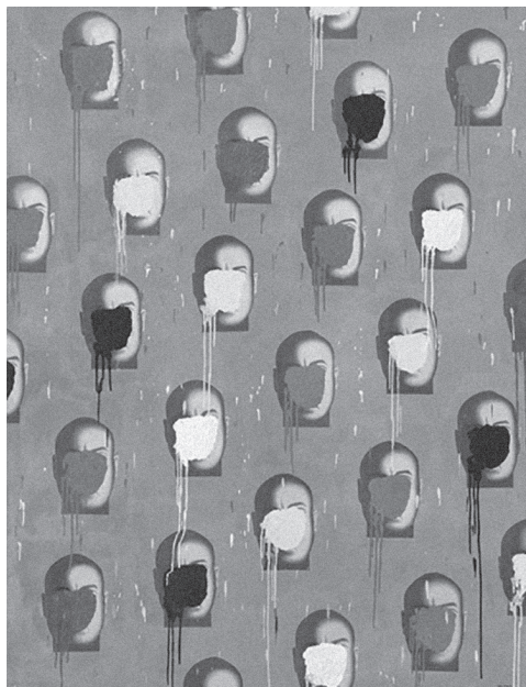
Fig.2 Hicham Benohoud, Sans-titre 3 , 2008, peinture à l'huile, 140 x 180 cm, © Hicham Benohoud