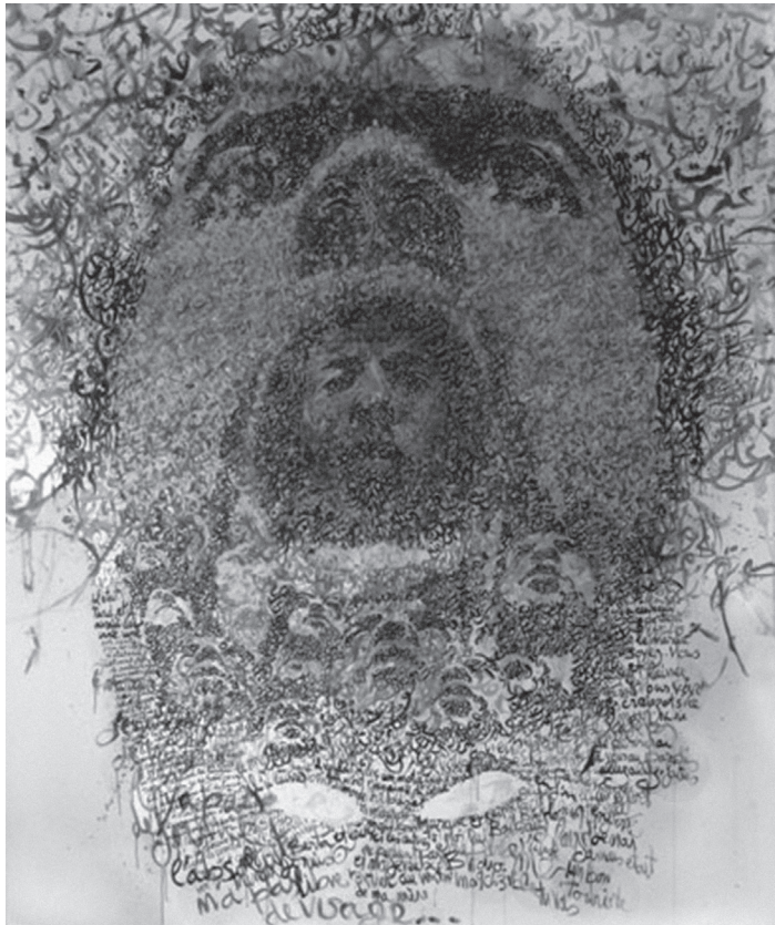
Fig. 5 Zakaria Ramhani, Face of your Other 07 , 2010, huile sur toile, 240 x 200 cm, © Zakaria Ramhani