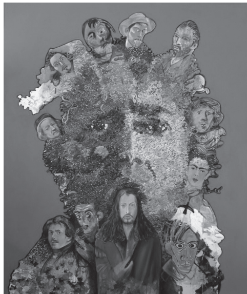
Fig. 6 Zakaria Ramhani, My Face is a Word , 2010, huile sur toile, 240 x 220 cm, © Zakaria Ramhani