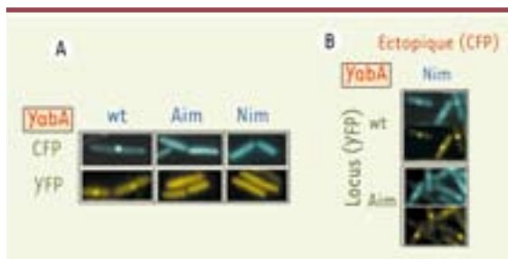
Figure 2. Effet des mutations de rupture d'interaction sur la localisation subcellulaire de yabA. A. YabA et ses dérivés sont étiquetés par la YFP ou la CFP et exprimés dans B. subtilis . Les observations sont réalisées par microscopie à épifluorescence sur cellules vivantes. YabA localise de façon réplisomale en formant un focus au centre de la cellule. L'introduction des mutations de perte d'interaction à DnaN (Nim) et à DnaA (Aim) se traduit par la perte de la capacité à former des focus et la localisation devient diffuse dans la cellule. B. Restauration de la localisation par complémentation entre yabA Aim et Nim. La co-expression dans la cellule d'un YFP-YabA et d'un mutant CFP-Nim s'accompagne de la re-localisation du mutant Nim, indiquant que ce dérivé muté participe à la formation d'un hétérocomplexe fonctionnel avec la protéine YabA sauvage. La co-expression des deux mutants CFP-Nim et YFP-Aim complète leur déficience pour la localisation et restaure la formation de focus par le complexe YabA/DnaA/DnaN au centre de la cellule.