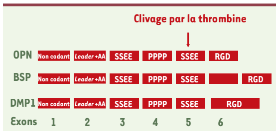
Figure 1. Exons des gènes de la famille SIBLING, situés sur le chromosome 4 humain. L'exon 1 est toujours non codant, l'exon 2 comporte la séquence leader et code pour les deux premiers acides aminés (AA) de la protéine mature, l'exon 3 comporte la séquence consensus SSEE pour la phosphorylation par la caséine kinase II (CKII), l'exon 4 code pour la séquence riche en proline qui confère sa charge positive à la molécule, l'exon 5 contient un site CKII et le seul site connu d'épissage alternatif (pour les protéines OPN et DMP1). La majorité des protéines de cette famille est codée par les deux derniers exons et contient un motif RGD (arginine-glutamine-aspartate) se liant aux intégrines. Tous les introns sont de type codon 0, permettant un épissage entre tous les exons sans causer de décalage dans le cadre de lecture. Le gène de l'OPN a été cloné pour la première fois en 1986 [72], et a été décrit depuis chez plus de six espèces différentes, avec des régions carboxy- et aminoterminales bien conservées, contenant notamment le motif RGD. BSP : bone sialoprotein ; DMP1 : dentin matrix protein 1 .

Sous sa forme sécrétée, on la détecte dans le lait (environ 5 µg/ml), l'urine, la bile et le liquide labyrinthique (oreille interne). Enfin, on a décrit une forme intracellulaire périmembranaire de l'OPN, l'iOPN, dans des fibroblastes fœtaux migrants [18].