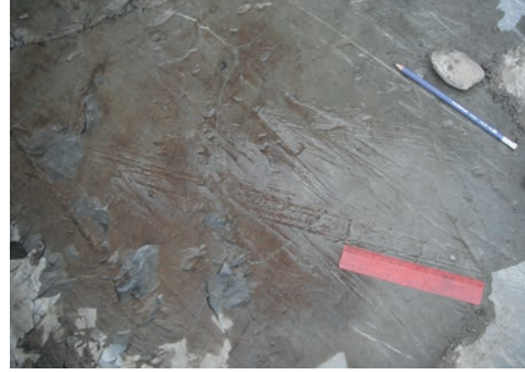
Socle rocheux poli et strié par le passage des glaciers en Gaspésie, 2011.

C'est la toundra qui a d'abord recouvert la péninsule, le climat étant encore influencé par les glaciers à proximité. Certaines espèces de plantes arctiques-alpines héritées de cette période colonisent encore les milieux les plus hostiles de la Gaspésie où elles ont pu perdurer sans trop de compétition. Les sommets des monts Albert et Jacques-Cartier, dans le parc de la Gaspésie, ainsi que les falaises maritimes du parc national Forillon en sont les exemples les plus connus. Les arbres ont migré peu à peu vers nos latitudes pour prendre la place de la toundra. La