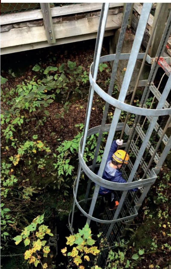
Puits d'ouverture de la grotte de Saint-Elzéar aménagé pour faciliter l'accès aux visiteurs.

Fait intéressant, on y retrouve des crânes et ossements d'ours couverts d'une couche de plusieurs millimètres de calcite, indice de leur