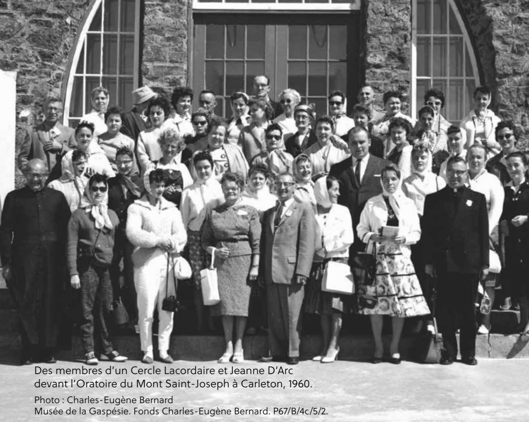
Des membres d'un Cercle Lacordaire et Jeanne D'Arc devant l'Oratoire du Mont Saint-Joseph à Carleton, 1960.

Photo : Charles-Eugène Bernard Musée de la Gaspésie. Fonds Charles-Eugène Bernard. P67/B/4c/5/2.