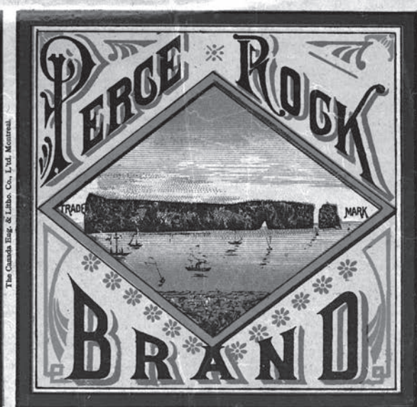
Étiquette identifiant l'entreprise de transformation du homard par les Mabe.

Source : Musée de la Gaspésie. Fonds Daniel Mabe. P68/1e/3