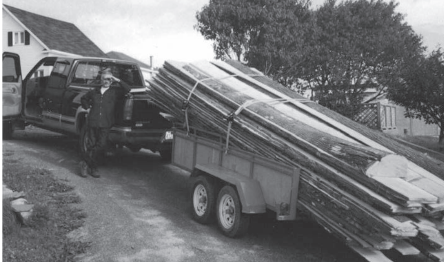
Paul-Émile Cloutier, l'un des derniers faiseurs de barge, se procure des planches de cèdre à L'Anse-à-Beaufils.