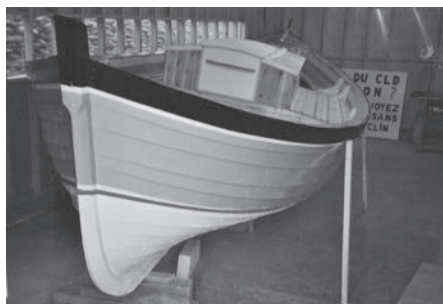
Étapes de construction d'une barge par Paul-Émile Cloutier, dont le père était lui-même faiseur de barges. Sur la photo du centre, on aperçoit les anciens moules de Jos Joncas utilisés par Cloutier.