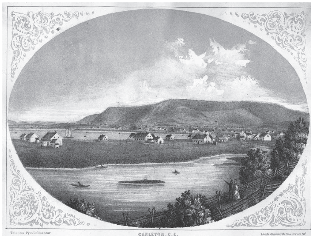
Le banc de Carleton, un lieu idéal pour la construction navale.

Pour construire une goélette, il faut bien sûr du bois, des hommes habiles en charpenterie ainsi qu'un lieu à proximité de l'eau. En première étape, on construit d'abord la structure de base, soit la quille, l'étrave et l'étambot 2 . Dans un deuxième temps, une fois que le squelette de la goélette est monté, les bordages sont fixés sur les baux ou