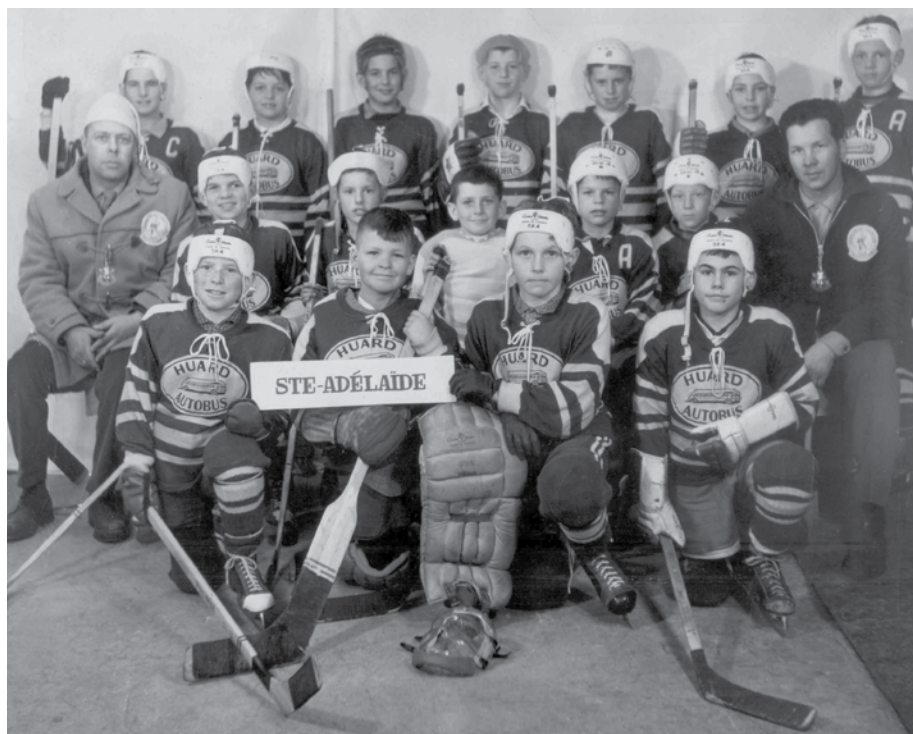
L'équipe de Sainte-Adélaïde-de-Pabos lors du tournoi pee wee de Chandler en 1966.