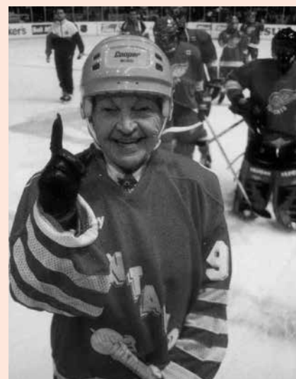
Hazel Journeaux-McCallion, pionnière du hockey féminin en Gaspésie et au Canada.

À la fin des années 1930, Hazel Journeaux – originaire de Port-Daniel – joue avec ses deux sœurs pour l'équipe de l'endroit dans une ligue de hockey féminin rassemblant les équipes de Chandler, Port-Daniel et New Carlisle. À Montréal en 1940, elle joue pour le club Kik où on la paie 5 $ par partie. Elle quitte le Québec pour l'Ontario et des décennies plus tard, elle devient mairesse de Mississauga, poste qu'elle occupe de 1978 à 2012. En 1987, Hazel Journeaux-McCallion obtient la tenue d'un premier Championnat de hockey féminin dans sa ville d'adoption. Ce tournoi sera suivi par la tenue à Ottawa en 1990 du premier Mondial qui reçoit la reconnaissance de la Fédération internationale de hockey sur glace et ouvre la voie à la participation des hockeyeuses aux Jeux olympiques de 1998 4 .