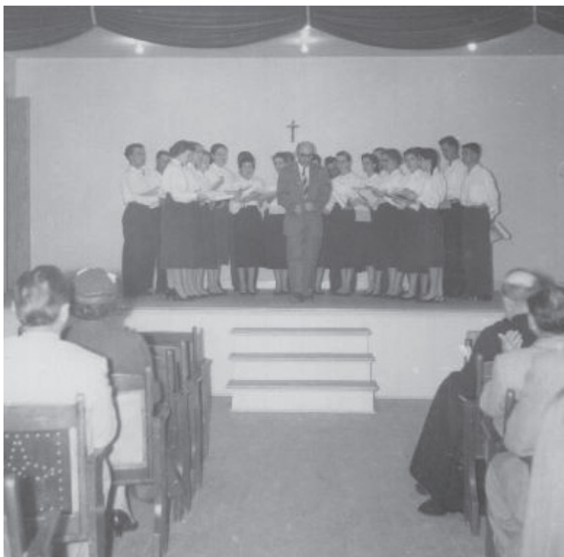
Les Compagnons de la Musique en récital.

deviner une pointe de retenue dans l'expression, un certain sous-entendu, un non-dit souvent plus efficace qu'une trop grande précision comme dans L'Empereur d'Autriche ou L'habitant . Quelques autres titres de son répertoire trouvent encore un écho dans notre actualité : Le pont de Longueuil , Les députés , La vaccination , Le petit chasseur , Le Matou et Anna .