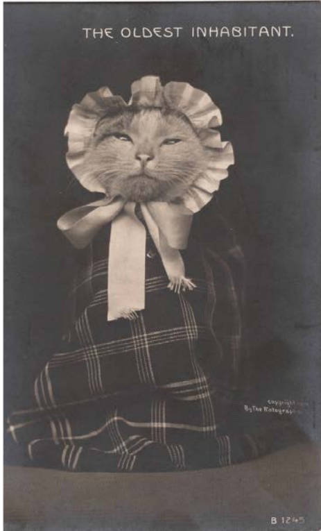
Figure 2. Harry Whittier Frees, « The Oldest Inhabitant », carte postale, The Rotograph, vers 1906. Library of Congress.