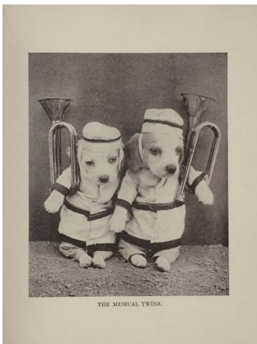
Figure 6. Harry Whittier Frees, « The Musical Twins », photographie publiée dans Animal Land on the Air , Boston, Lothrop, Lee & Shepard Co.1929, p. 71.