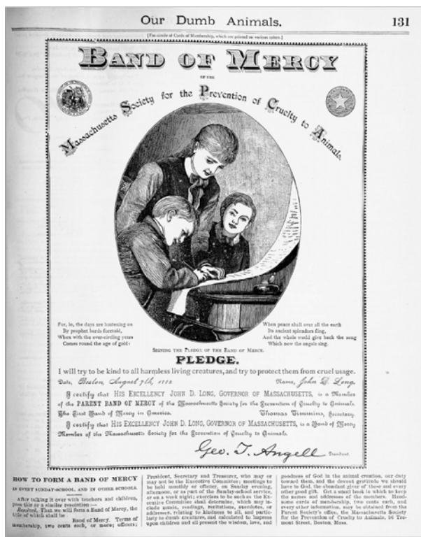
Figure 4. Our Dumb Animals , 1er septembre 1882, p. 131.