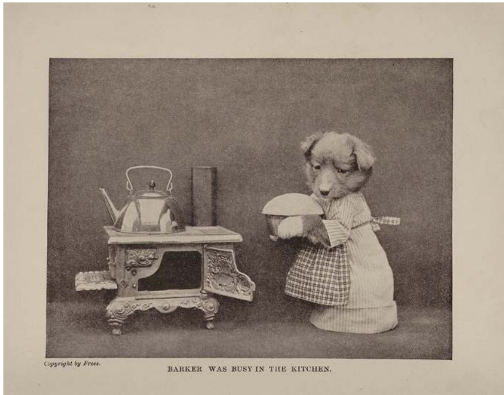
Figure 1. Harry Whittier Frees, « Baker was busy in the kitchen », photographie publiée dans The Little Folks of Animal Land , Boston, Lothrop, Lee & Shepard Co., 1915, p. 21. Library of Congress.