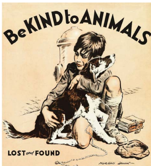
Figure 5. Morgan Denis, « Young boy hugging his dog », Be Kind to Animals Week Poster, 55.88 x 43.18 cm, 1933. Onondaga County Public Library (OCPL) https://nyheritage.contentdm.oclc.org/digital/collection/sr_r_ocpl/id/2320/rec/2 .