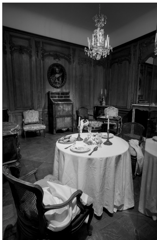
Fig. 2 Détail de la period room « Un Salon français vers 1750-1760 », Samuel European Galleries, niveau 3, Royal Ontario Museum, Toronto, 2018.