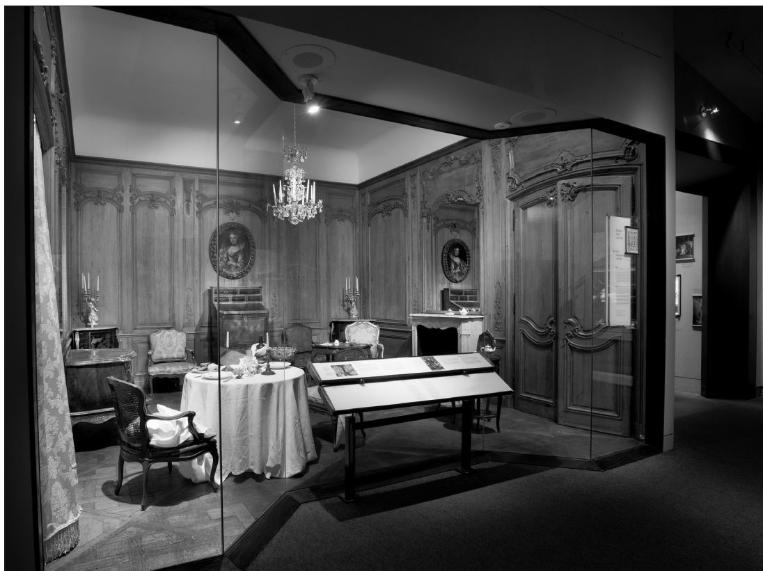
Fig. 1 Vue d'ensemble de la period room « Un Salon français vers 1750-1760 », Samuel European Galleries, niveau 3, Royal Ontario Museum, Toronto, 2018.

Au moyen de l'étude de la pièce « Un salon français vers 1750-1760 » présentée au Royal Ontario Museum de Toronto (Fig. 1), cet article analyse certaines des implications méthodologiques et épistémologiques issues du processus de (re)construction, d'interprétation et de médiation des récits historiques au moyen de la period room au musée. La première partie traite de la matérialisation de l'histoire dans la period room en étudiant l'organisation syntaxique des éléments qui composent ce « salon français ». Elle montre ainsi comment la mise en exposition peut produire des « effets de récit » dont l'articulation repose sur l'investissement narratif du visiteur, et ce, peu importe la lecture qu'il ou elle fera de la mise en scène qui lui est proposée 3 . La seconde partie considère les effets du contexte muséal pour la valeur du récit en tant qu'outil de construction et de transmission de connaissances. Elle révèle comment la period room articule les tensions entre la légitimité scientifique de l'institution et la valorisation de l'expérience des visiteurs. En fin de compte, cette étude contribue à expliquer