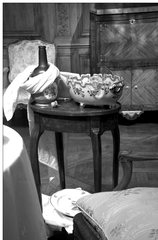
Fig. 3 Détail de la period room « Un Salon français vers 1750-1760 », Samuel European Galleries, niveau 3, Royal Ontario Museum, Toronto, 2018.