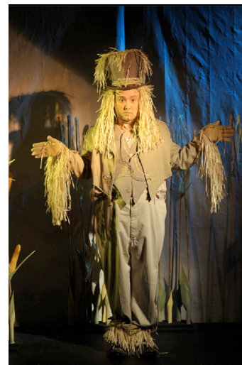
Les mécaniques célestes