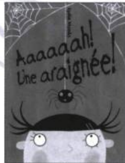
Aaaaaah! Une araignée! 0-439-96688-4