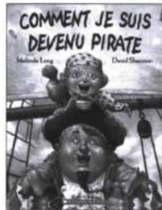
Comment je suis devenu pirate 0-439-96691-4