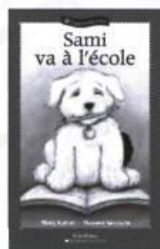
Sami va à l'école 0-439-96602-7

Chair de poule. Six titres à paraître en septembre!