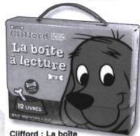
Clifford : La boîte à lecture no 4 0-439-96198-X