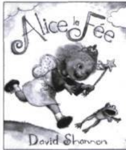
Alice la Fée 0-439-96275