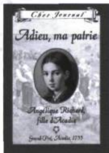
Adieu ma patrie 0-439-96137-8