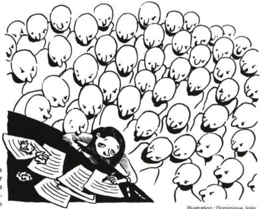
Illustration : Dominique Jolin