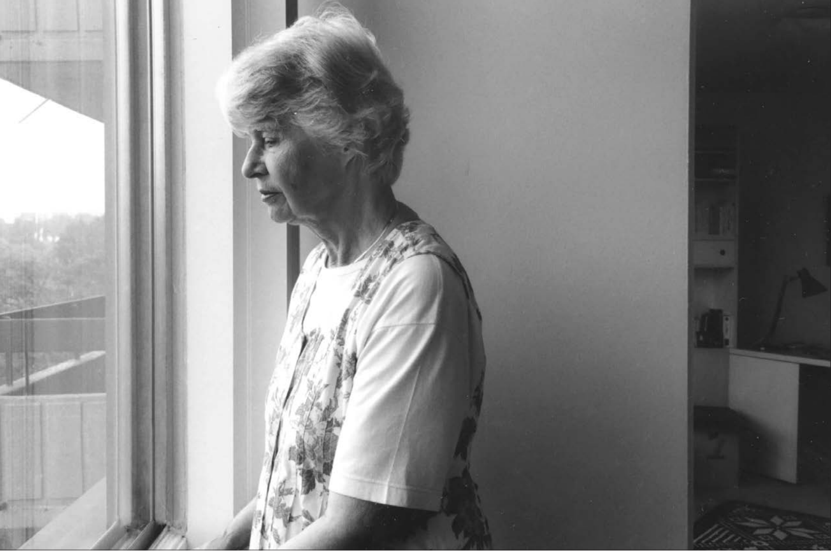
Anne Hébert devant la fenêtre de son appartement montréalais.