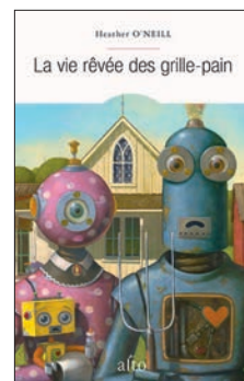
☆☆☆☆ Heather O'Neill La vie rêvée des grille-pain traduit de l'anglais (Canada) par Dominique Fortier Québec, Alto 2017, 400 p., 27,95 $

Or, devant La vie rêvée des grille-pain , nous sommes un peu comme ces enfants – avalant ces histoires avec avidité, rabattant le couvercle sur nos platitudes, accueillant le triste et le doux que les métaphores de l'auteure, si puissantes, pourront remuer en nous. ♦