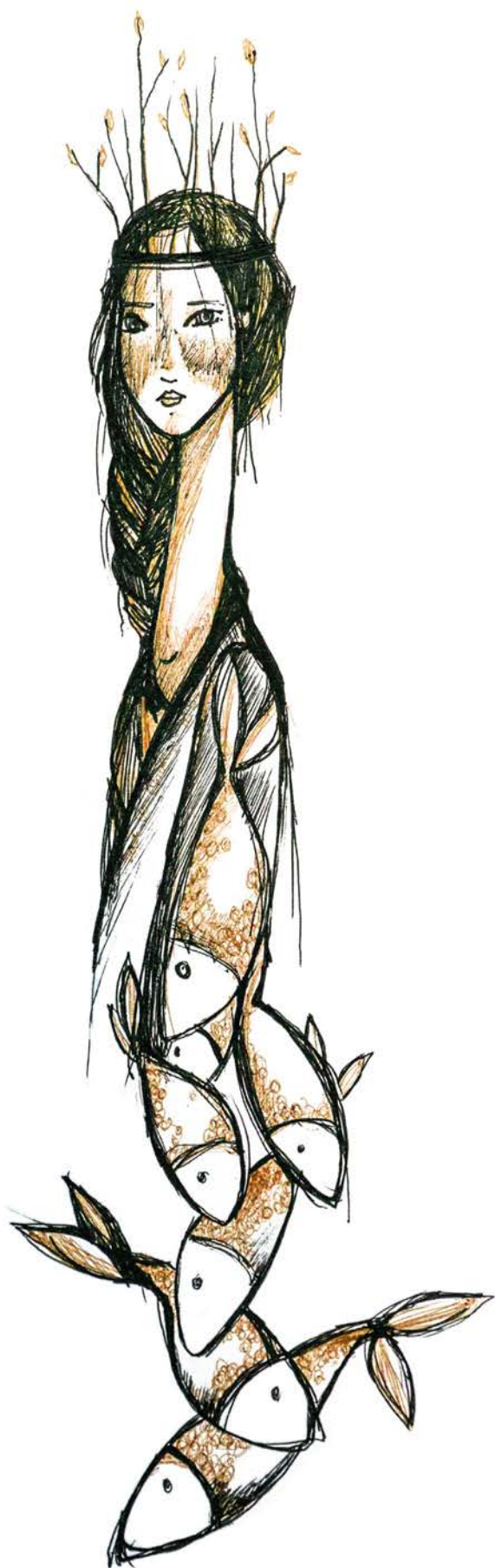
Illustration : Audrée Wilhelmy

Sur les autoportraits que j'esquisse dans mes cahiers, rien n'est visible du ventre ou des mains. Il reste les cheveux, ils encadrent les traits habituels ; front, sourcils, yeux, nez, bouche. Ce visage-là m'apparaît secondaire et je peux le dessiner très lisse. Je le contrôle bien. Je sais le placer pour une photo, dans les conférences, les rencontres d'auteurs, si mes mains sont libres de bouger comme elles veulent, lui demeure ouvert et concentré. (Lorsque je parle, ça se gâte parce que je grimace beaucoup,