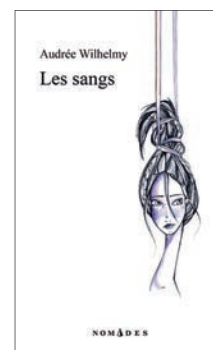
Les sangs Montréal, Leméac, coll. « Nomades » 2017 (2013), 176 p., 9,95 $