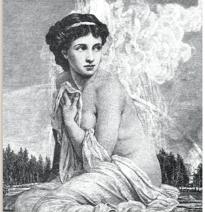
ILLUSTRATION TIRÉE D'ENCYCLOPÉDIE DU MONDE VISIBLE

Le travail accompli ici par la traductrice est, comme d'habitude, sensible et soigné. J'ai toutefois l'impression que la magie fonctionne mieux en anglais et que, pour vraiment appré-