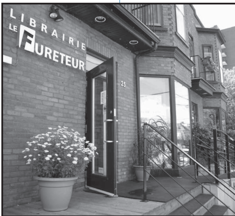
LE FURETEUR, UN EXEMPLE D'UNE LIBRAIRIE INDÉPENDANTE ACCUEILLANTE

La question des prix coupés, parfois en deçà du prix coûtant, est un enjeu important dans la situation actuelle troublée par la crise économique. « Les librairies indépendantes vont surtout être touchées par le ralentissement économique parce que, en temps de crise, ceux qui pratiquent les guerres de prix, certaines chaînes et les grandes surfaces, sont encore plus agressifs. Les librairies indépendantes n'ayant pas les moyens d'assumer une guerre de prix, ce sont toujours, dans les crises, les perdantes. Je ne pense pas que les librairies indépendantes vont disparaître demain matin, mais, en temps de crise, c'est sûr qu'on est les premiers touchés. »