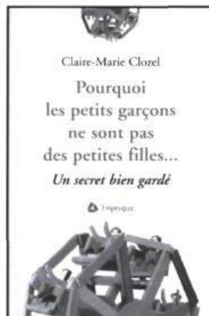
CLAIRE-MARIE CLOZEL Pourquoi les petits garçons ne sont pas des petites filles... Un secret bien gardé essai, 185 p., 20 $

habiter depuis la peau explorer l'aval et l'amont du zeste