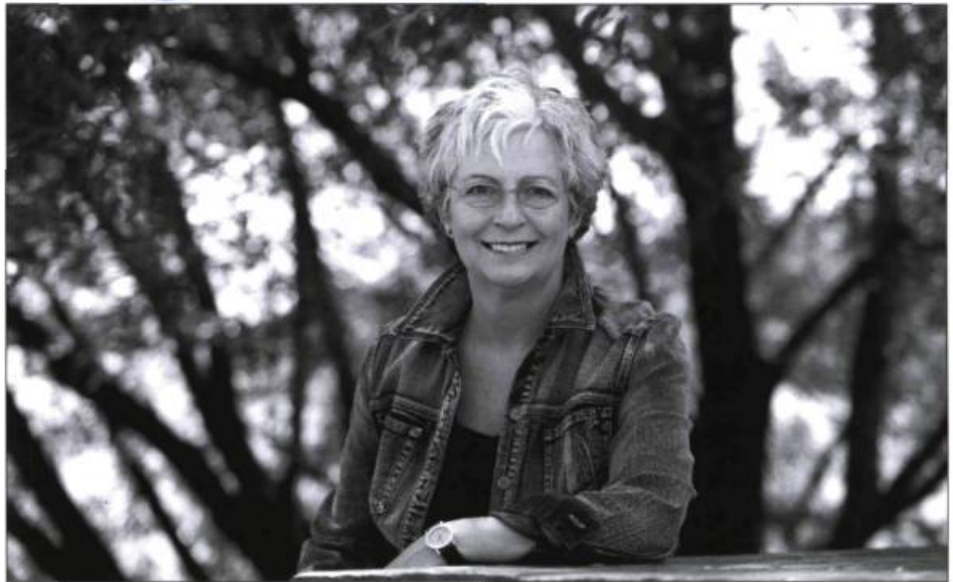
A U D E

Dans « Iris », l'une des nouvelles de Cet imperceptible mouvement , Alexandre, un photographe professionnel, est obsédé par ce désir fou de capter l'impalpable :