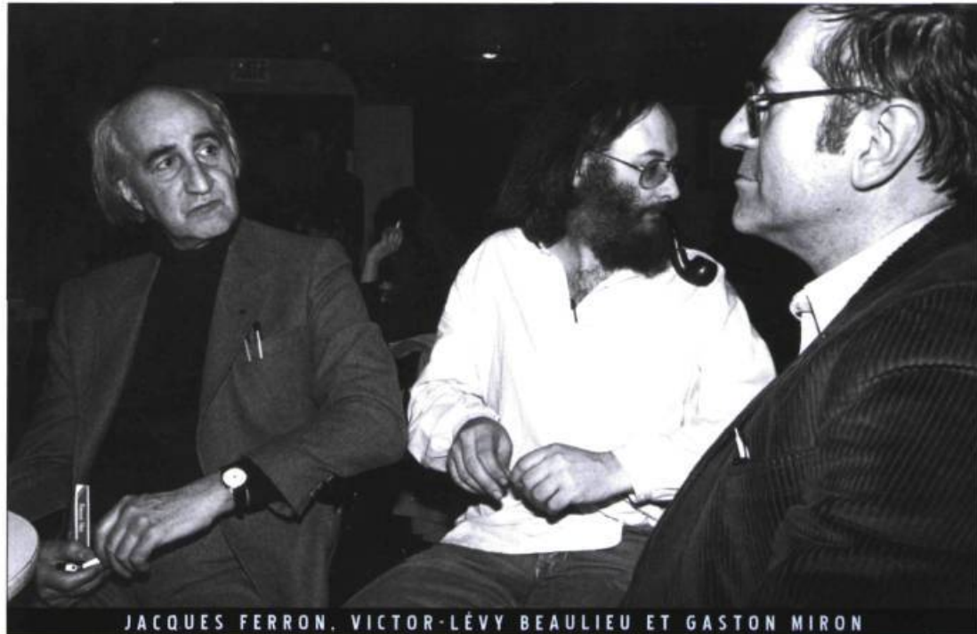
JACQUES FERRON. VICTOR-LÉVY BEAULIEU ET GASTON MIRON

En outre, le volet épistolaire en tant que tel (p. 35-96) est intéressant de par l'évolution qu'il propose, notamment par la relation qui prend de l'essor à mesure que nous progressons dans le temps. Surtout de la part de Beaulieu qui, tout en s'adressant souvent à son correspondant par la formule pompeuse « Éminence », semble toujours vouloir l'honorer. Au fil des lettres, le jeune Victor-Lévy Beaulieu ne tarit pas d'éloges face à son idole : « À côté de vous, nous sommes de bien petits poissons. » (p. 48) ; « Je vous aime, je vous considère comme le plus grand de nous