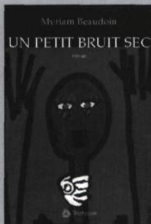
MYRIAM BEAUBOIN Un petit bruit sec roman, 108 p., 17 $