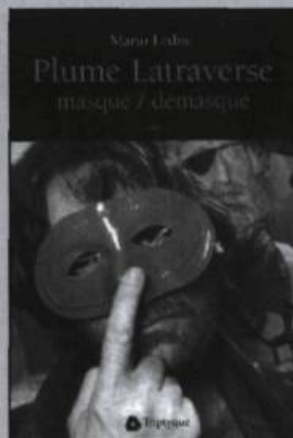
MARIO LEDUC Plume Latraverse masqué / démasqué essai, 226 p., 22 $

«Les gens ont fait le choix de te ranger pour toujours dans un cercueil étanche et insonorisé. Moi je te propose un nid de feuilles tout près de la vie qui jase. Installe-toi. Vois comme je t'écris. Ne t'arrête pas au décès qui n'a plus d'importance. Entre avec moi dans le pays handicapé par la sécheresse, dans la villa blanche rue des bougainvillées, saisis ta Lucia, repartons tous à bord du ferry, for ever sur le ferry...»